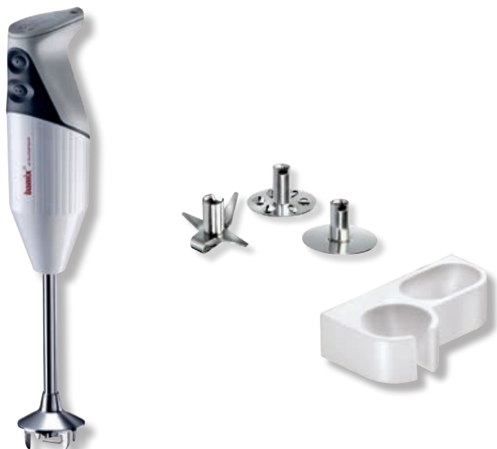
bamix® Gastro S 200 Bianco