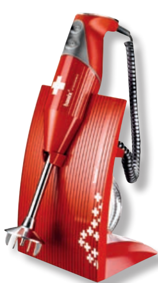
bamix Superbox BX SB RD