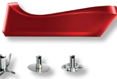
bamix® Cordless Plus