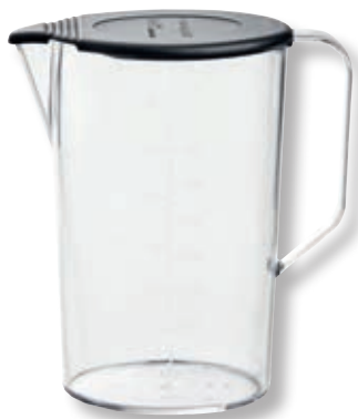
Brocca in Tritan