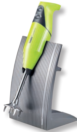
bamix® SwissLine Lime BX SL GR