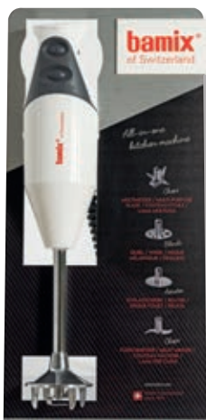
Alu-Table Display BX 795.064