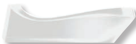
bamix® Cordless Plus