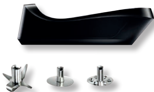
bamix® Cordless Plus