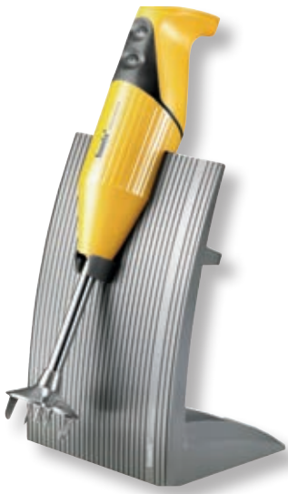
bamix® SwissLine Mango BX SL MA