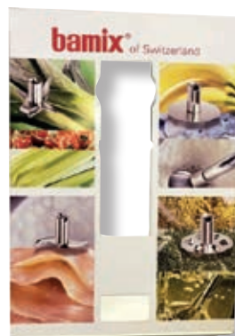
Display bamix Tavolo BX DSP B