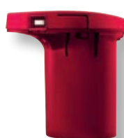
Batteria per Cordless