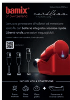
Cartello bamix Cordless BX A5