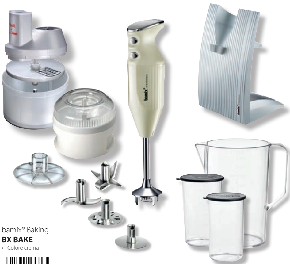
bamix® Baking BX BAKE