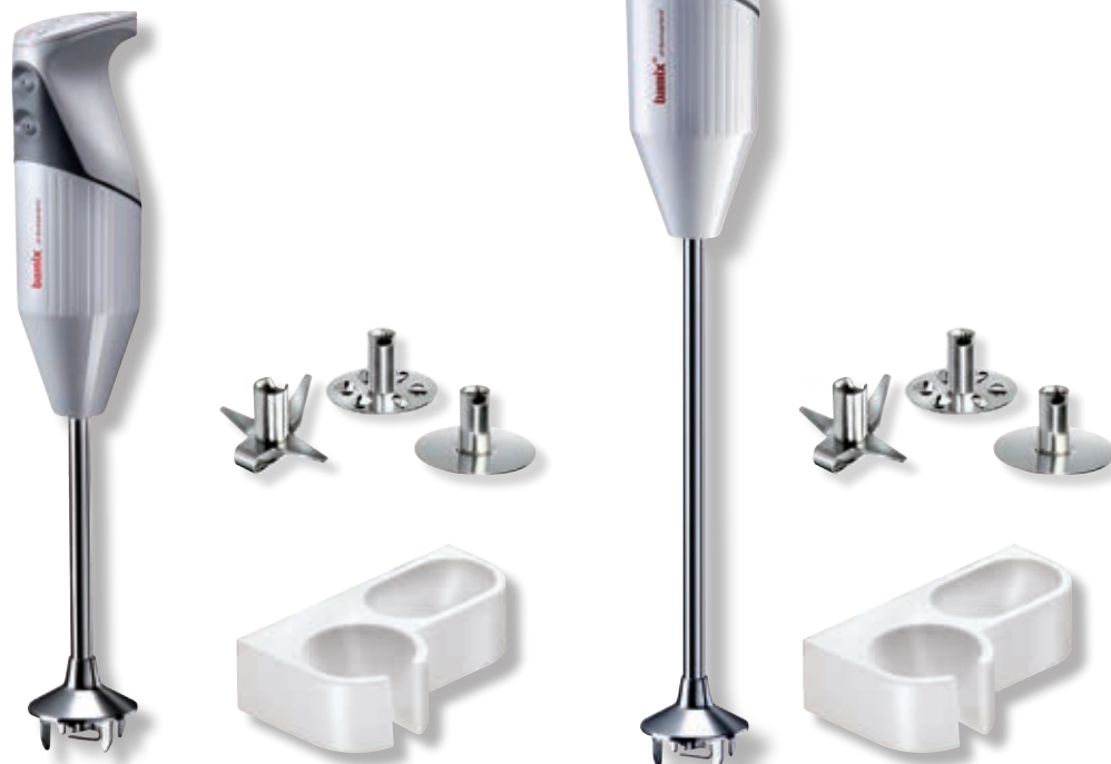
bamix® Gastro M 200 Bianco