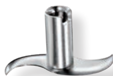
Lama per carne e verdura