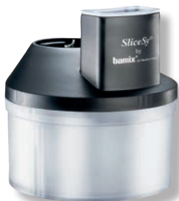
SliceSy® BX 1500.003