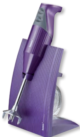
bamix Superbox BX SB PU