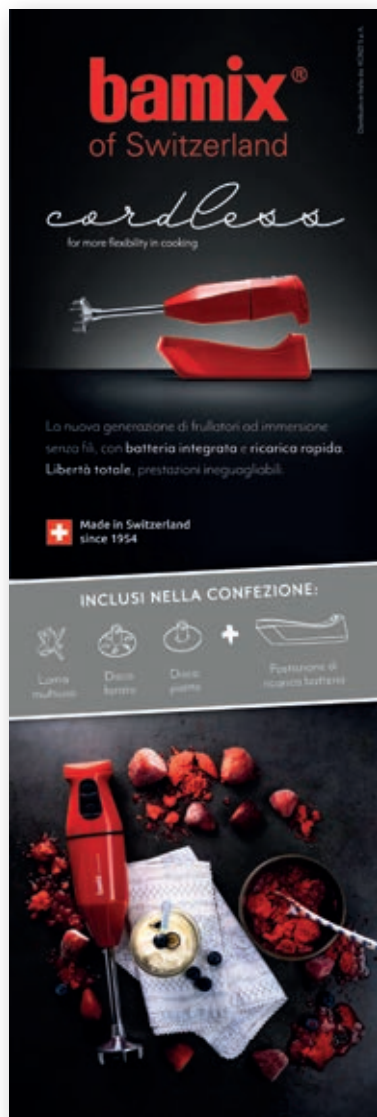
Banner bamix Cordless BX BN01