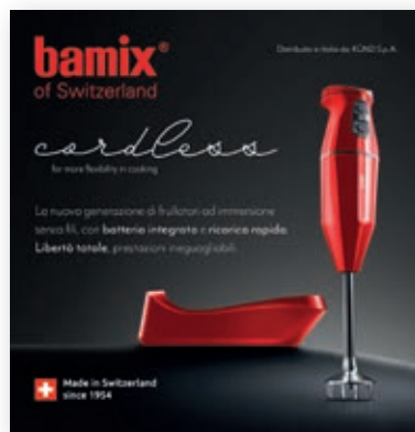
Forex bamix Cordless BX FX01