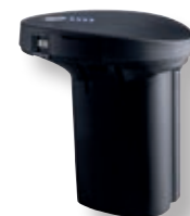
Batteria per Cordless