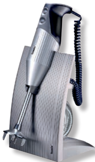
bamix® SwissLine Silver