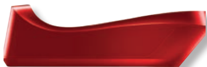
Caricatore per Cordless