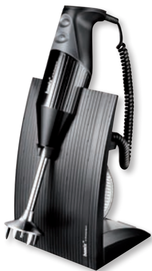
bamix Superbox BX SB BK