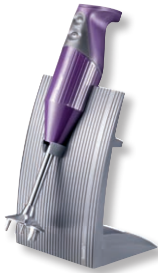
bamix® SwissLine Purple BX SL PU