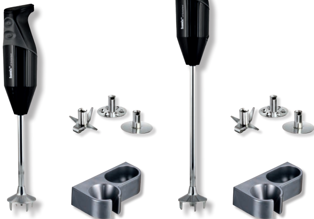
bamix® Gastro M 200 Nero