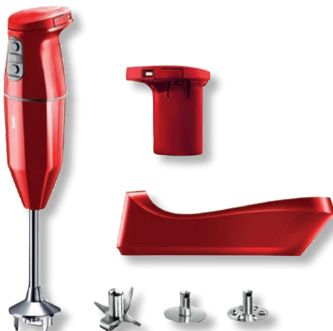
bamix® Cordless Plus