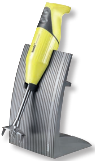
bamix® SwissLine Yellow BX SL YL