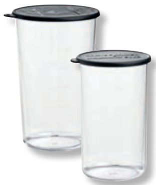
Set 2 Bicchieri in Tritan