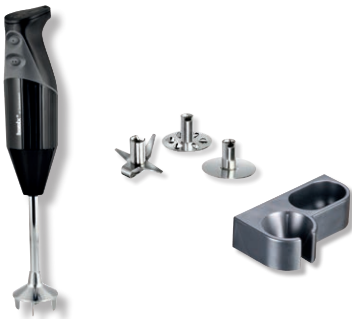
bamix® Gastro S 200 Nero