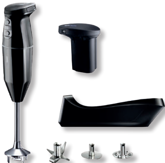
bamix® Cordless Plus