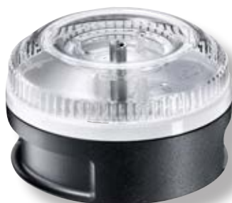
Processor BX 3001.001