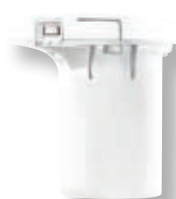
Batteria per Cordless