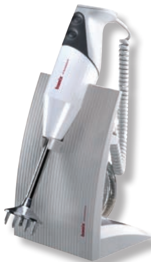
bamix® SwissLine White