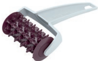
Cracker Roller BBS 155015.01