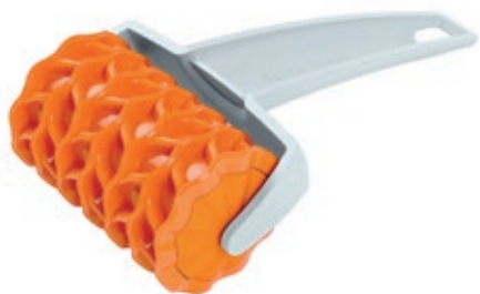
Grissini Roller BBS 155010.01