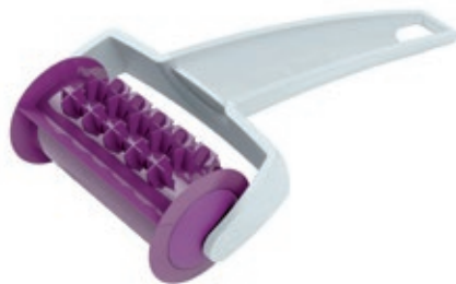
Star Roller BBS 155013.01