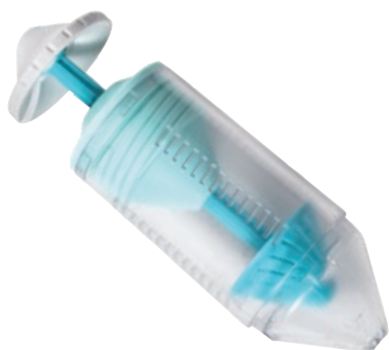
Deco Cream Whipper BBS 155019.01