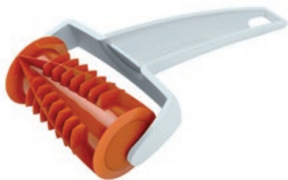
Christmas Roller BBS 155016.01