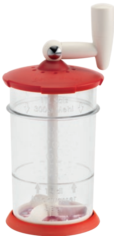
Spätzle Maker BBS 155004.01