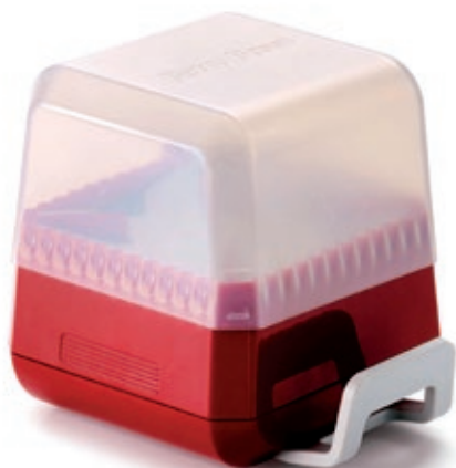
Wonderbox BBS 155006.01