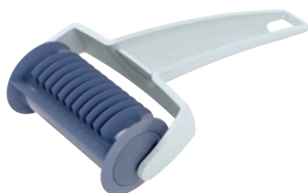
Stripes Roller BBS 155014.01