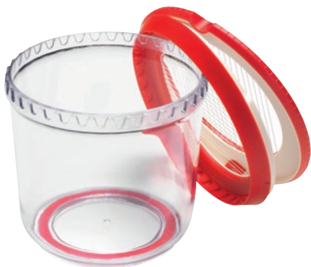
Hash Brown & Rösti Maker BBS 155005.01