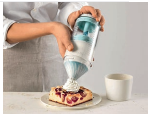
Deco Cream Whipper BBS 155019.01

Monta panna e decoratore per dolci di tutti i tipi, due funzioni in un unico strumento.