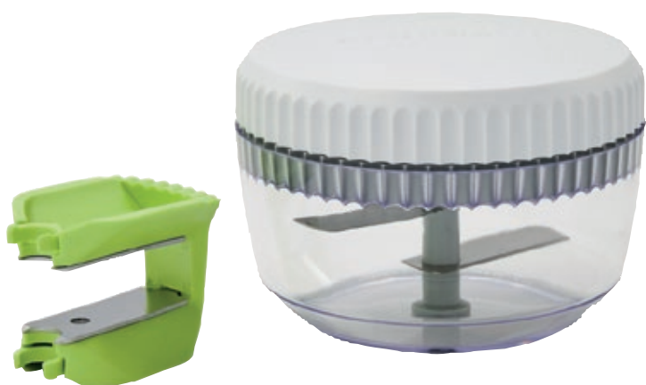
Onion&Herb Chopper BBS 155033.01