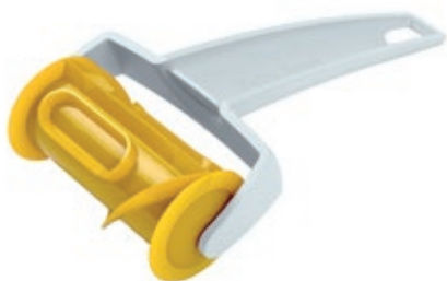
Croissant Roller BBS 155017.01