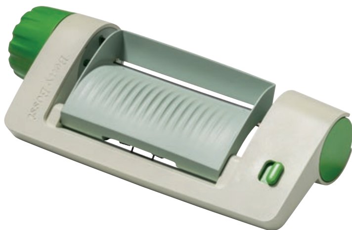
Veggie Sheet Slicer BBS 155024.01