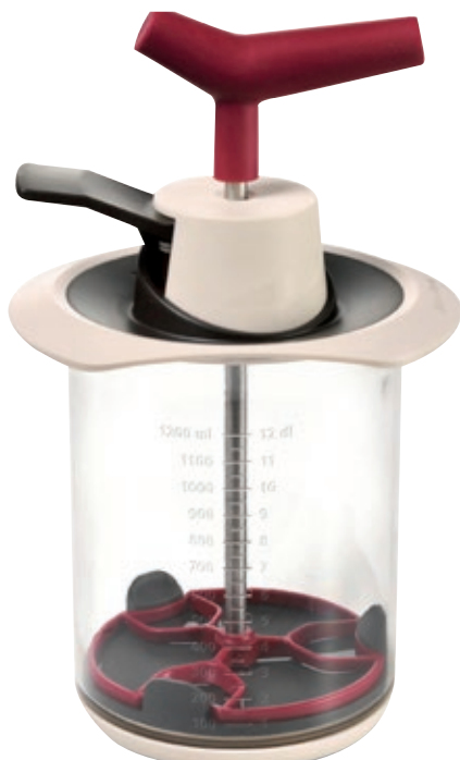
Batter Maker BBS 155007.01