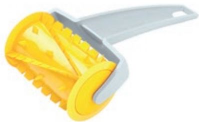
Nacho Roller BBS 155009.01