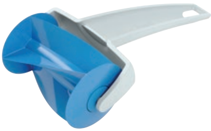
Pocket Roller BBS 155008.01