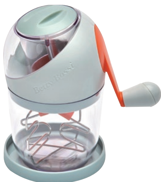
Sauce Maker BBS 155020.01