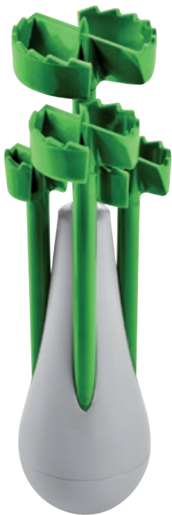
Veggie Drill BBS 155002.01