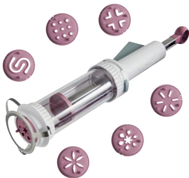
Cookie Press BBS 155037.01