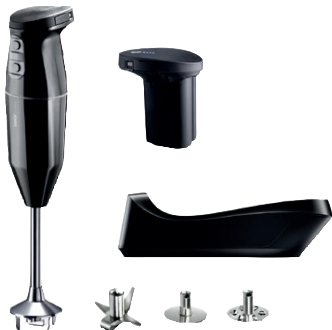
bamix® Cordless Plus