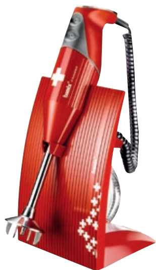
bamix® SwissLine Red