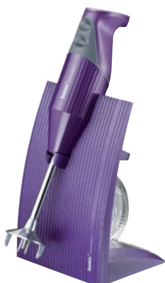
bamix Superbox BX SB PU • Colore purple