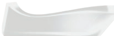
Caricatore per Cordless BX 3101.002 • Colore bianco

Caricatore per Cordless BX 3101 .. Questo caricatore dal design moderno e lussuoso consente di ricaricare bamix® Cordless in pochissimo tempo. • Compatibile con tutta la serie Cordless