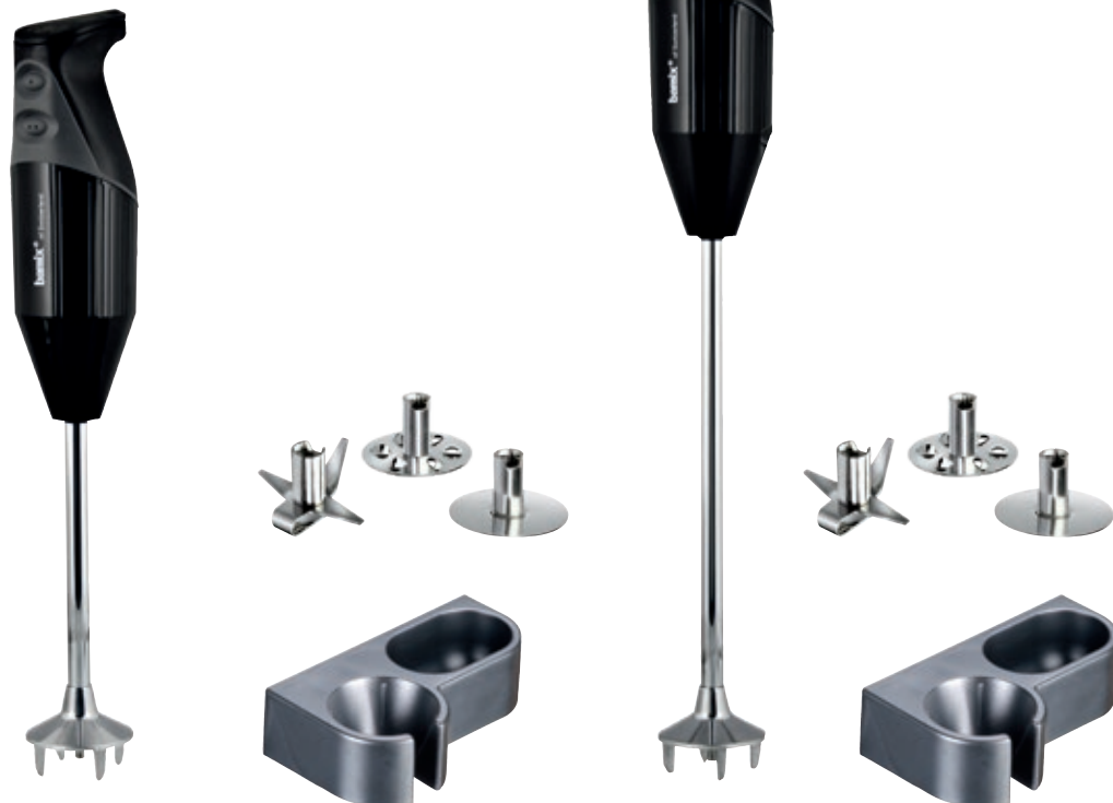
bamix® Gastro M 200 Nero