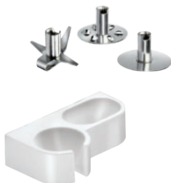
bamix® Gastro M 200 Bianco