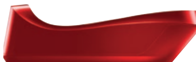
Caricatore per Cordless BX 3101.003 • Colore rosso

Caricatore per Cordless BX 3101 .. Questo caricatore dal design moderno e lussuoso consente di ricaricare bamix® Cordless in pochissimo tempo. • Compatibile con tutta la serie Cordless