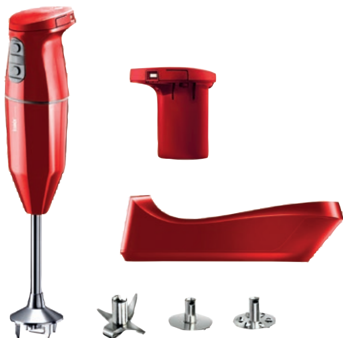
bamix® Cordless Plus