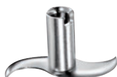
Lama per carne e verdura BX MEAT