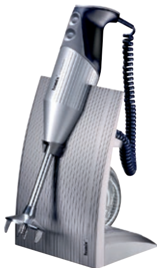
bamix® SwissLine Silver