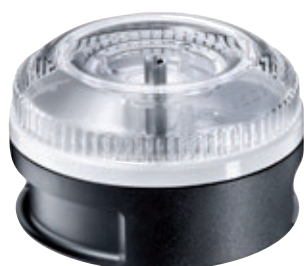
Processor BX 3001.001 • Colore nero

SliceSy® BX 1500.003 Da oggi potete anche affettare, grattugiare e tagliare a julienne verdura, frutta, formaggio e altro con l'aiuto del vostro bamix®. Adatto ai bamix® con almeno 180W di potenza.