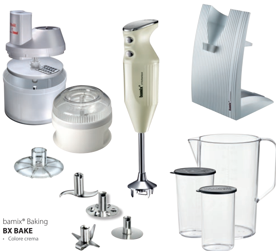
bamix® Baking BX BAKE • Colore crema

Una combinazione di accessori esclusivi per i fan della pasticceria dolce e salata.