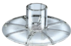
Powder Disc BX 440.050 • Confezione appendibile

Processor BX 440.010 Macinino per polverizzare adatto a tutti i bamix®, trita ingredienti secchi come erbe aromatiche, pane e cereali. Macina zucchero, spezie, cioccolato, formaggi stagionati e verdure essiccate. • Capacità: 100 ml