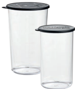
Set 2 Bicchieri in Tritan BX 450.050 • Capacità: 400 ml + 600 ml

Powder Disc BX 440.050 Viene utilizzato in combinazione con il PROCESSOR per macinare il cibo in polveri fini. Utilizzare per macinare il caffè, erbe aromatiche, spezie, vaniglia, pepe, e molti alimenti secchi.