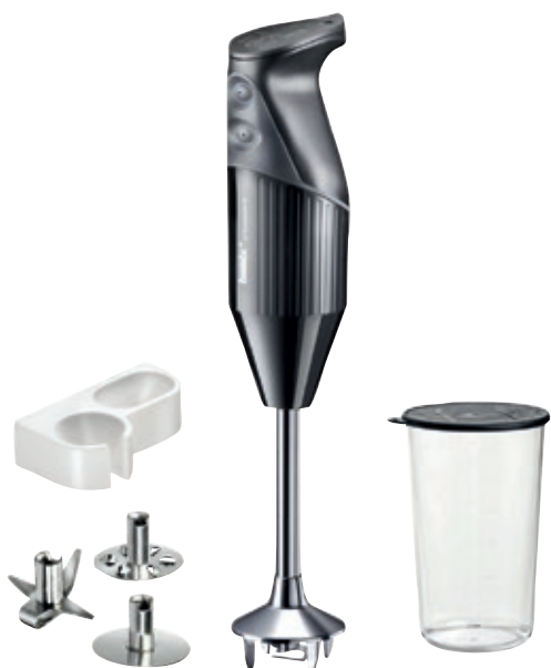
bamix® Mono Black