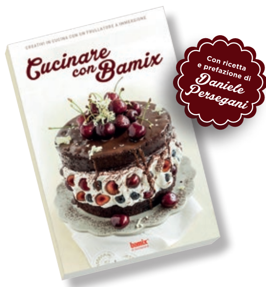
Book bamix K- BOOK BX