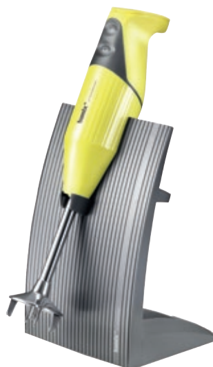
bamix® SwissLine Yellow