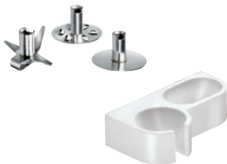
bamix® Gastro S 200 Bianco