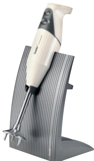
bamix® SwissLine Cream