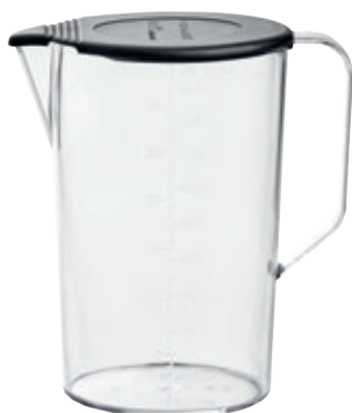
Brocca in Tritan BX 790.006 • Capacità: 900 ml

Set 2 Bicchieri in Tritan BX 450.050 Set due bicchieri trasparenti graduati con coperchio. • Materiale: Tritan • Antiurto • Adatto al congelatore • Capacità: 400 ml + 600 ml