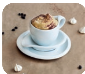
Disco Piatto BX 460.051

Ideale per tutto ciò che deve essere leggero, soffice e omogeneo. Monta panna e latte scremato, albumi, mousse. Emulsiona salse, creme e frappé.