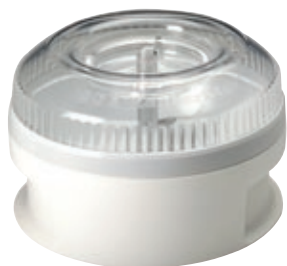
Processor BX 440.010 • Confezione appendibile

Processor BX 440.010 Macinino per polverizzare adatto a tutti i bamix®, trita ingredienti secchi come erbe aromatiche, pane e cereali. Macina zucchero, spezie, cioccolato, formaggi stagionati e verdure essiccate. • Capacità: 100 ml