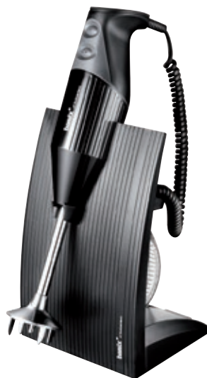
bamix® SwissLine Black