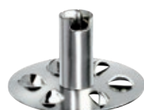
Disco Forato BX WHISK