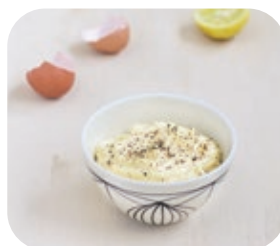
Lama multiuso BX 460.050

La lama universale di bamix®. Tritura, taglia e mescola tutto anche cibi congelati ed i cubetti di ghiaccio. Si utilizza direttamente nelle pentole sui fornelli senza la necessità di altri contenitori.