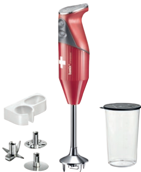
bamix® Mono Red