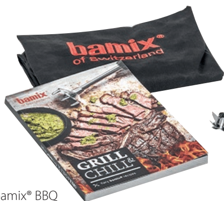
bamix® BBQ BX BBQ • Colore nero