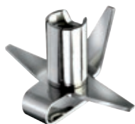
Lama multiuso BX 460.050 • Confezione in blister

La versatilità di bamix vi consentirà di utilizzarlo sempre, per ogni ricetta. Quattro lame intercambiabili per riuscire in ogni impresa!