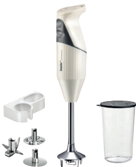
bamix® Mono Cream