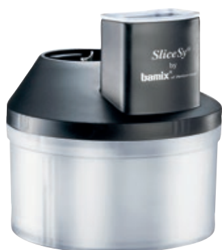
SliceSy® BX 1500.003 • Colore nero

SliceSy® BX 1500.003 Da oggi potete anche affettare, grattugiare e tagliare a julienne verdura, frutta, formaggio e altro con l'aiuto del vostro bamix®. Adatto ai bamix® con almeno 180W di potenza.