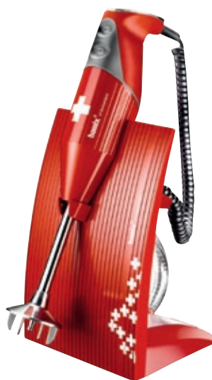
bamix Superbox BX SB RD • Colore rosso

bamix® Superbox è un pacchetto full optional. È Il modello più completo e possiede tutti gli accessori.