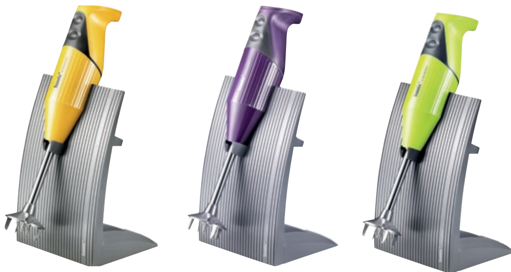
bamix® SwissLine Mango