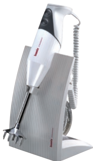
bamix® SwissLine White