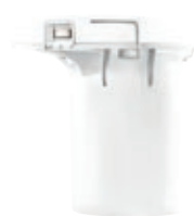
Batteria per Cordless BX 3100.002 • Colore bianco