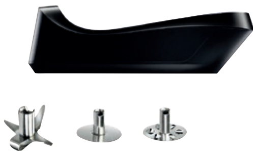
bamix® Cordless Plus