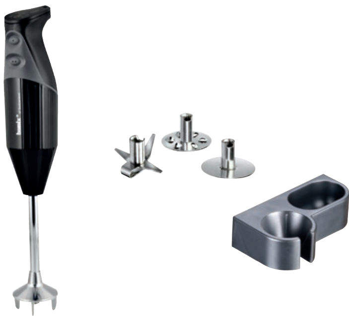
bamix® Gastro S 200 Nero