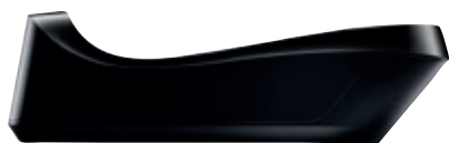
Caricatore per Cordless BX 3101.001 • Colore nero