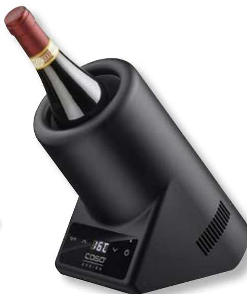
Raffreddatore di vino VinoCase