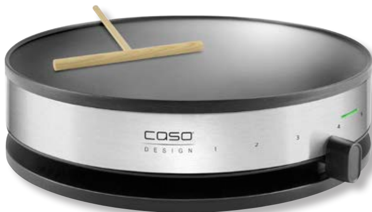
Crepiera elettrica CM 1300 - Design Crepes Maker