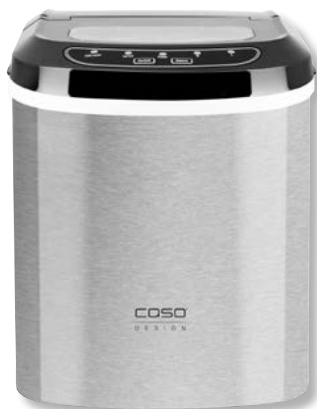
Macchina del ghiaccio IceMaster Pro