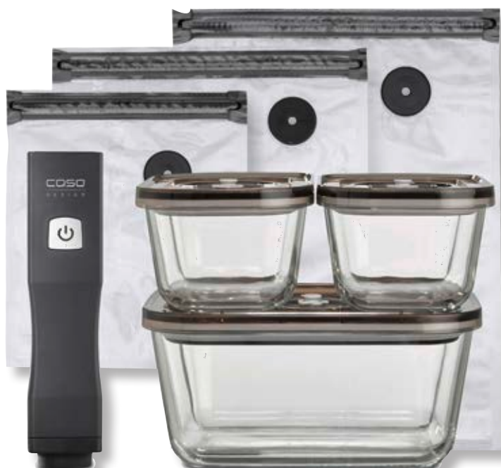
Set sottovuoto OneTouch Eco CSO 01169