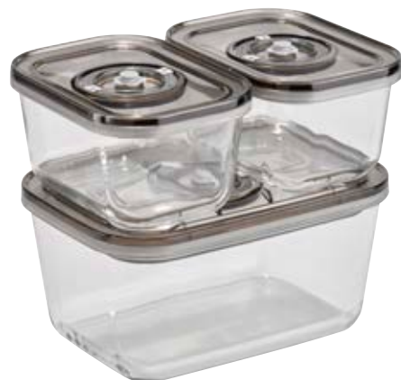
Contenitore per sottovuoto VacuBoxx Eco-Set