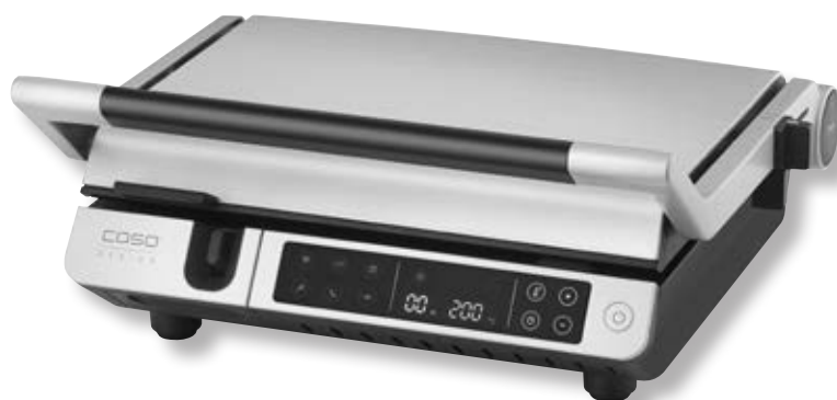
Piastra per grigliare SteakMaster Pro