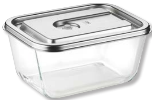
Contenitore per sottovuoto VacuBoxx Inox XL