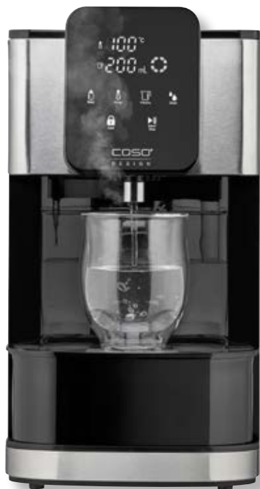
Bollitore HW1660 CSO 01884