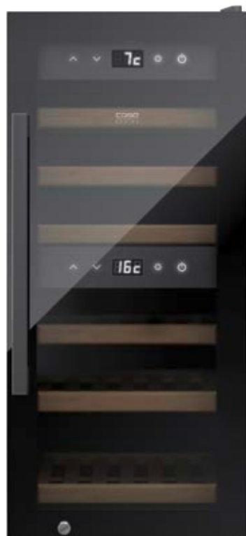
Cantinetta frigo WineExclusive 24 Smart