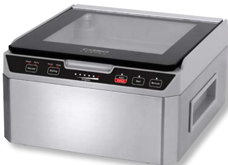
Camera per sottovuoto VacuChef 40