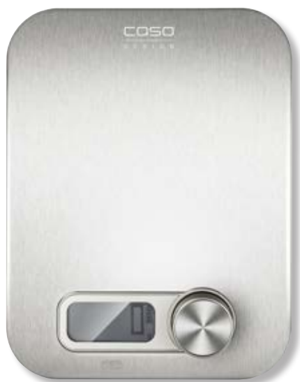
Bilancia Kitchen Energy