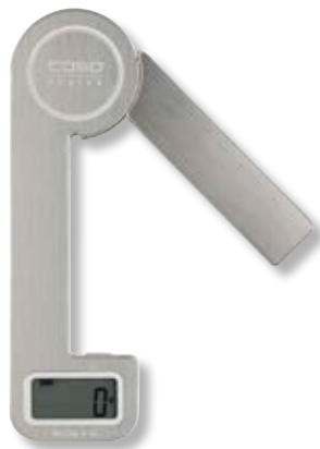
Bilancia Kitchen Ecostyle