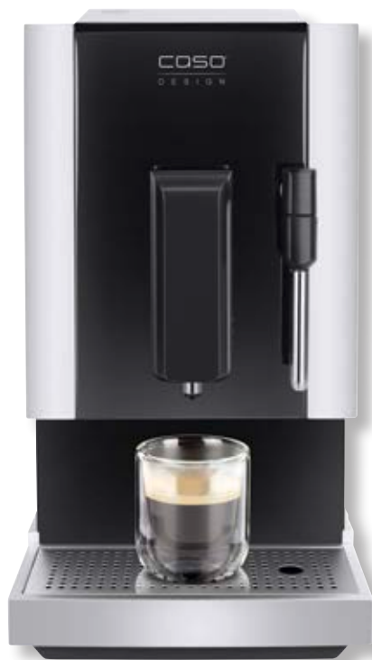
Macchina da caffè Café Crema One