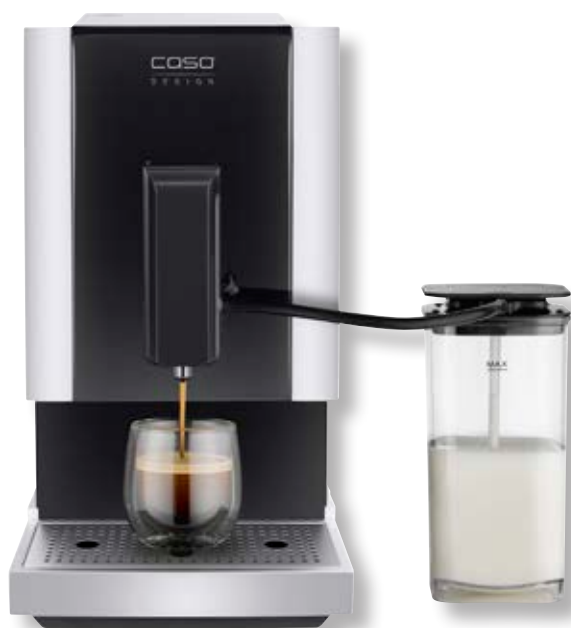
Macchina da caffè Café Crema Touch