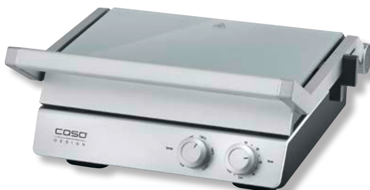
Piastra per grigliare SteakChef