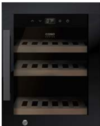
Cantinetta frigo WineExclusive 12