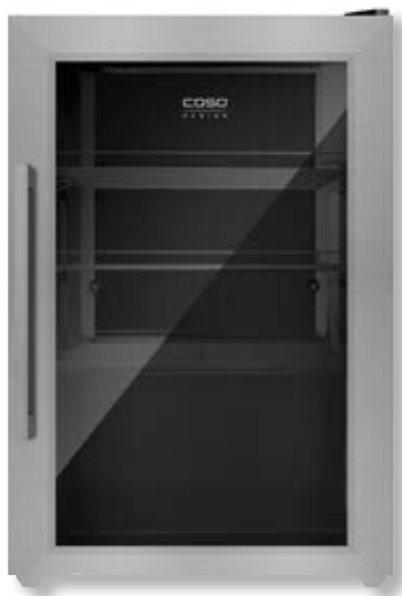
Frigorifero BBQ Cooler S-R CSO 00700