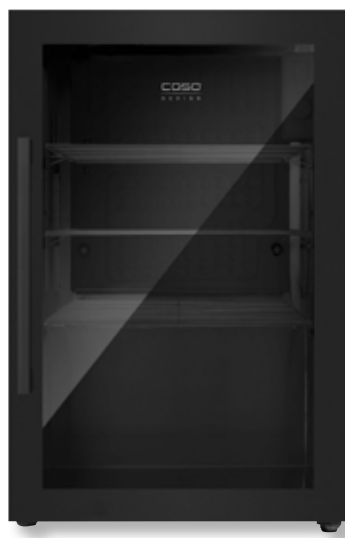
Frigorifero BBQ Cooler S-R CSO 00702