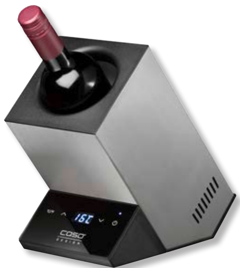
Raffreddatore di vino WineCaseOne