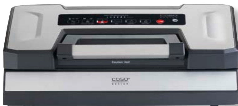
Barra per sottovuoto VRH 790 advanced Pro