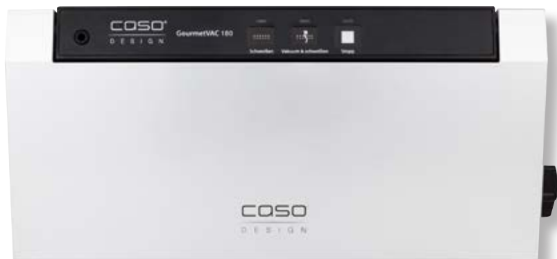
Barra per sottovuoto GourmetVAC 180