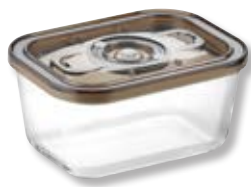
Contenitore per sottovuoto VacuBoxx Eco M