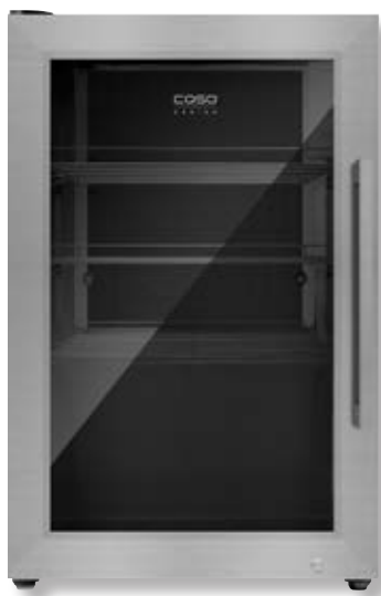
Frigorifero BBQ Cooler S-L CSO 00701