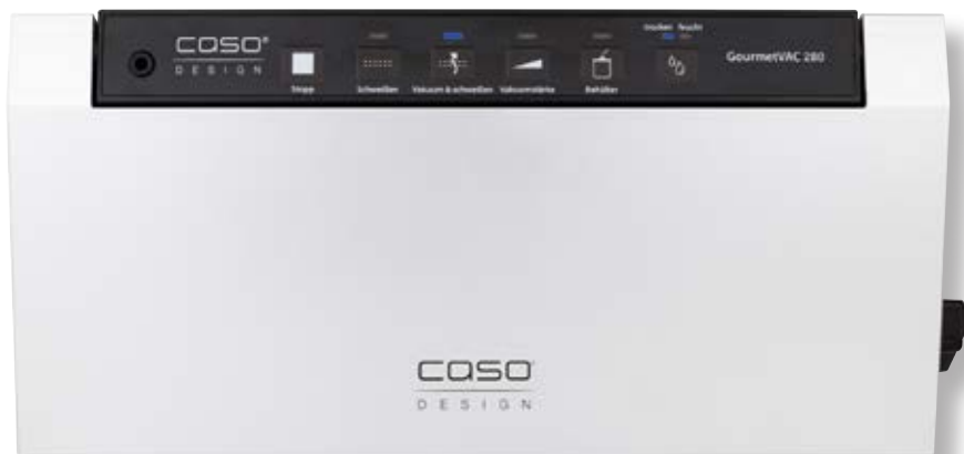
Barra per sottovuoto GourmetVAC 280