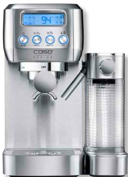
Macchina da caffè Espresso Gourmet Latte