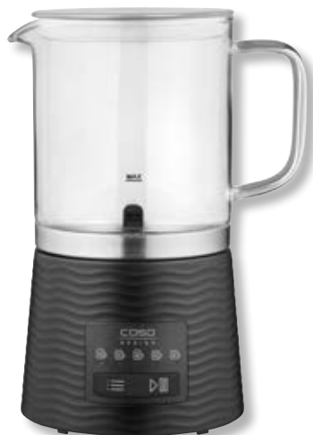
Montalatte CappuLatte Black