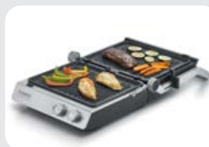
Piastra per grigliare SteakMaster Pro