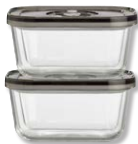
Contenitore per sottovuoto VacuBoxx Eco-Duo S