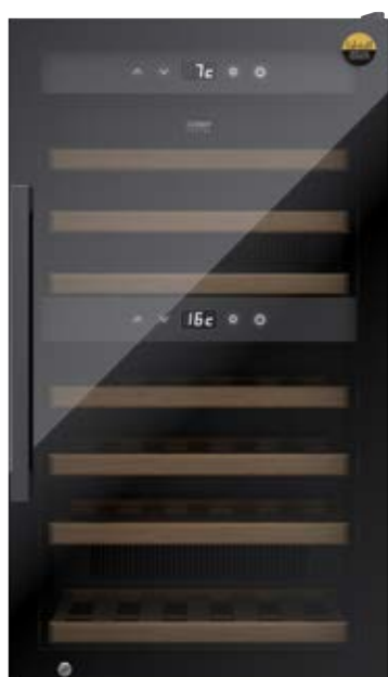
Cantina frigo WineExclusive 66 Smart