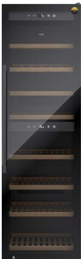
Cantinetta frigo WineExclusive 180 Smart