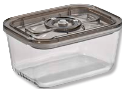
Contenitore per sottovuoto VacuBoxx Eco L