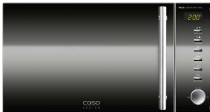
Forno a microonde MG 20 Ceramic