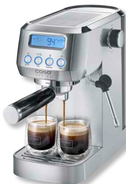
Macchina da caffè Espresso Gourmet Crema