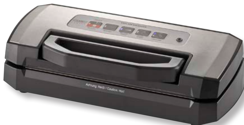
Barra per sottovuoto VRH 490 advanced