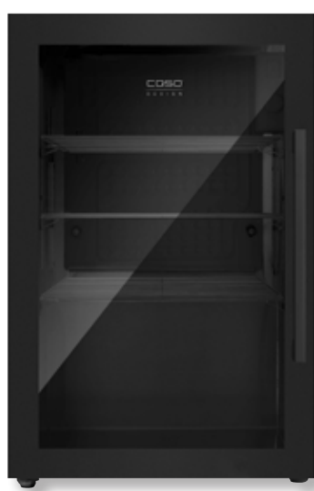
Frigorifero BBQ Cooler S-L CSO 00703