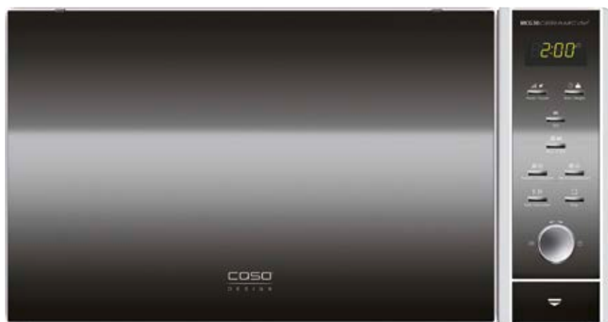
Forno a microonde MCG 30 Ceramic Chef