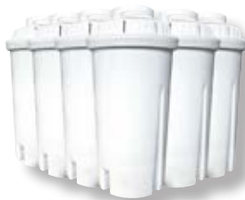
Set 6 filtri di ricambio