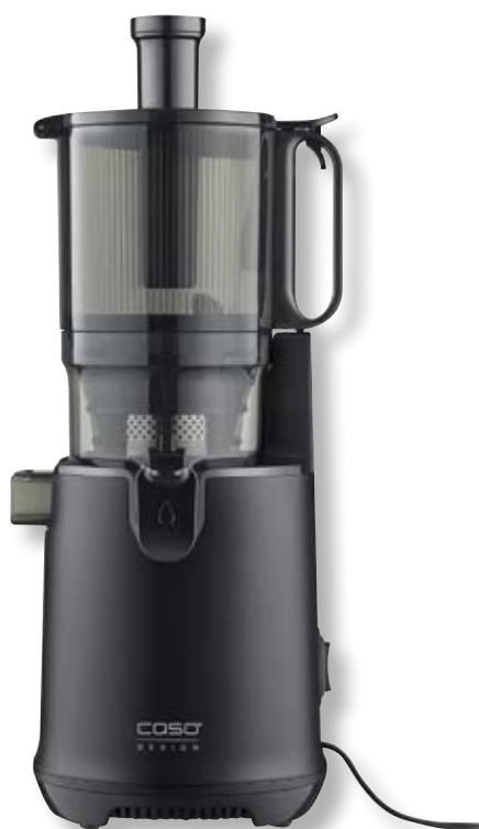
Estrattore di succo Juice Fit Pro