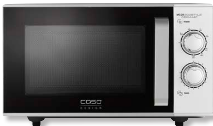
Forno a microonde MG 25 Ecostyle Ceramic