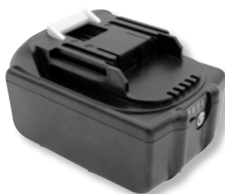
Batteria di ricambio