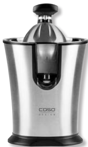
Spremiagrumi CP 300