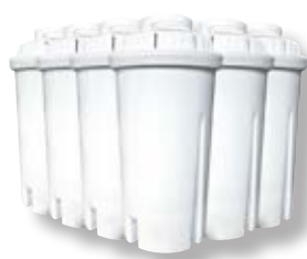
Set 6 filtri di ricambio