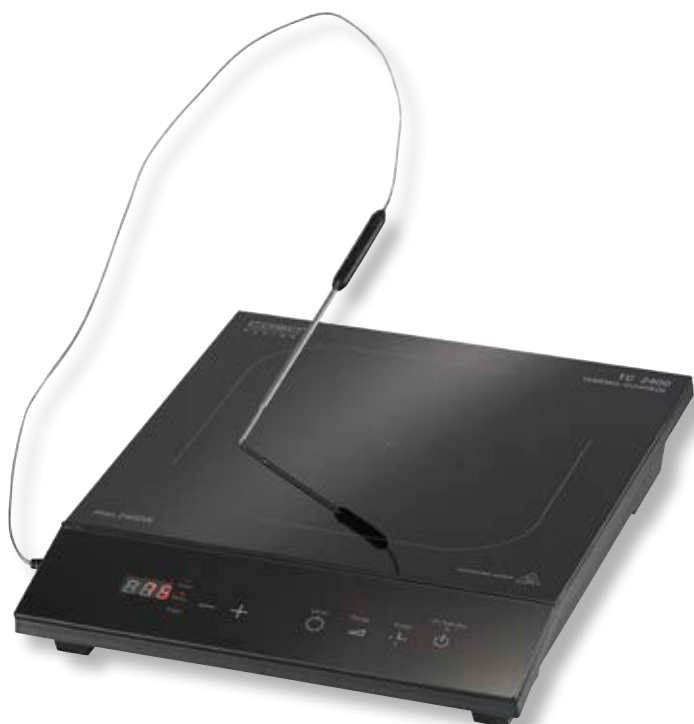
Piano cottura induzione TC2400 ThermoControl