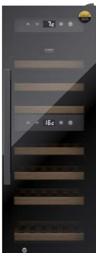
Cantina frigo WineExclusive 38 Smart