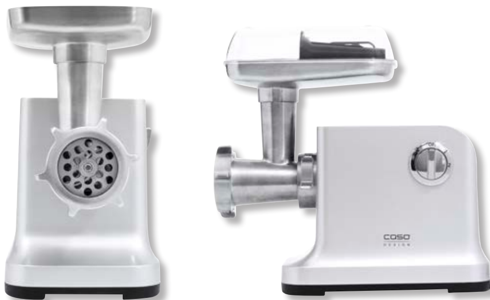
Tritacarne FW 2000 - Fleischwolf