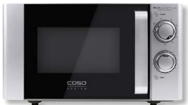
Forno a microonde MG 20 Ecostyle Ceramic