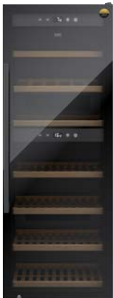
Cantinetta frigo WineExclusive 126 Smart