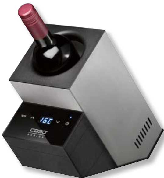
Raffreddatore di vino WineCase Deluxe