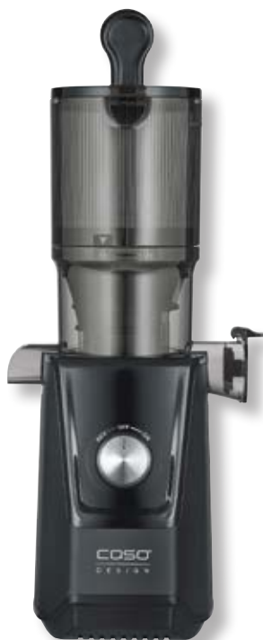
Estrattore di succo Juice Fit