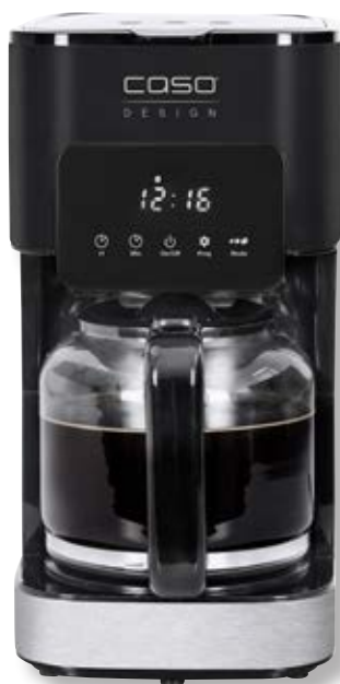
Macchina da caffè Coffee Taste & Style