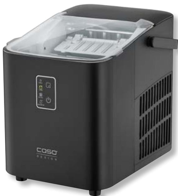
Macchina del ghiaccio IceChef Compact