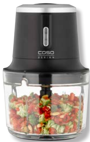
Tritatutto Chop & Go Akku-Multizerkleinerer