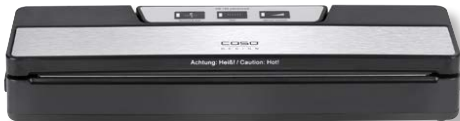
Barra per sottovuoto VR 190 advanced