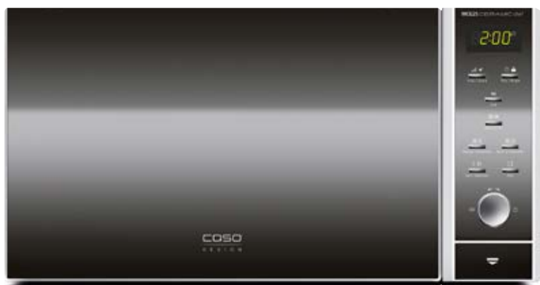
Forno a microonde MCG 25 Ceramic Chef