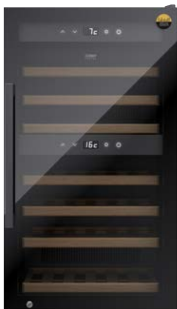
Cantina frigo WineExclusive 66 Smart