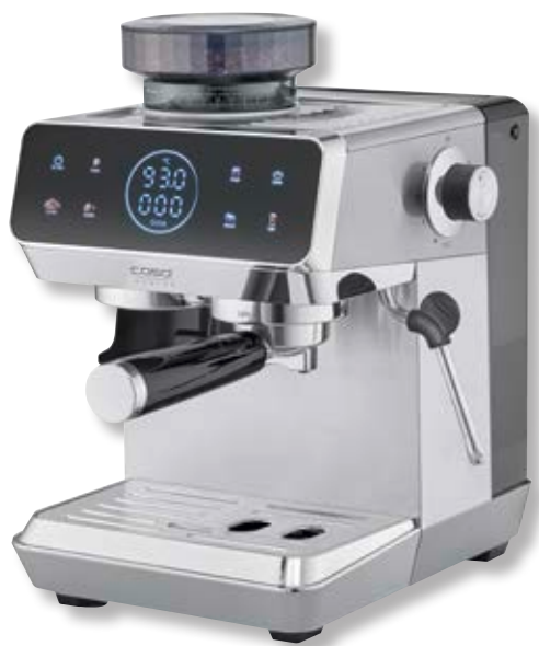
Macchina da caffè Espresso Gourmet Grind