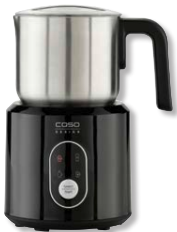
Montalatte Crema &amp; Choco Black