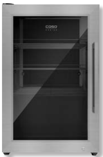
Frigorifero BBQ Cooler S-L CSO 00701