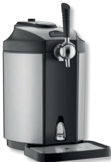
Dispenser di birra BeerMaster