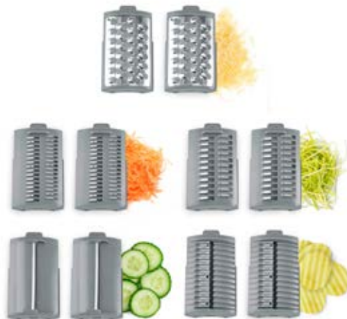
Affettatrice MultiSlicer CSO 01752