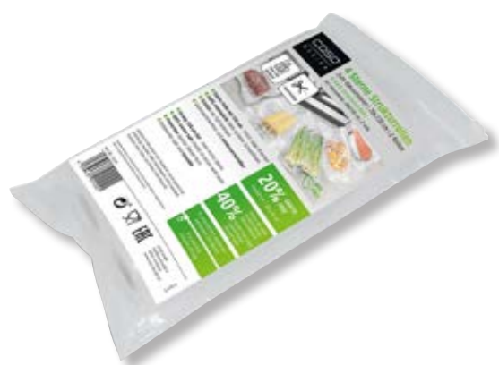
Confezione 2 rotoli gofrato 4-Stars