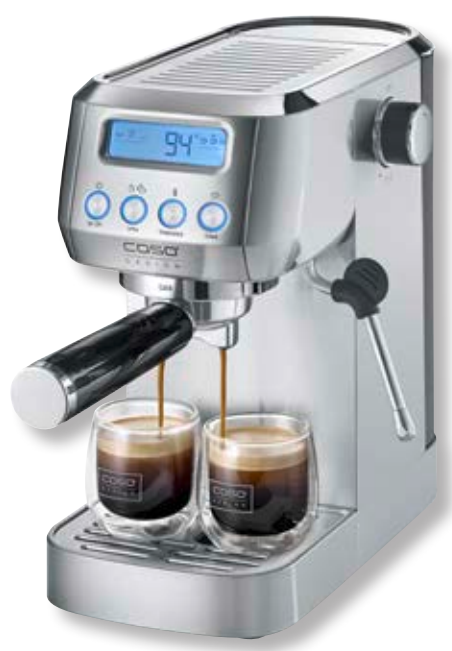
Macchina da caffè Espresso Gourmet Crema