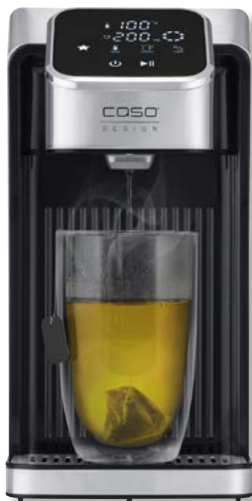
Bollitore HW 770 Advanced