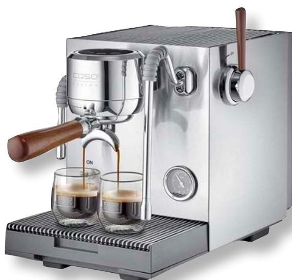
Macchina da caffè Espresso Gourmet Advanced