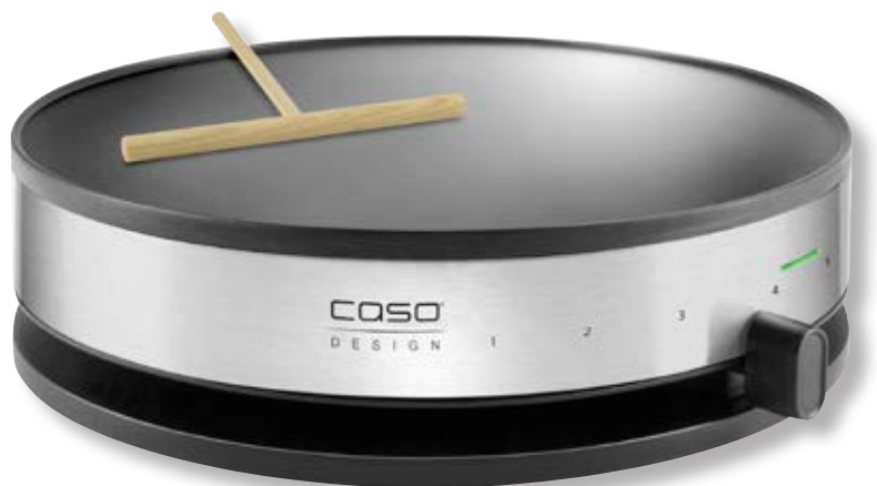
Crepiera elettrica CM 1300 - Design Crepes Maker