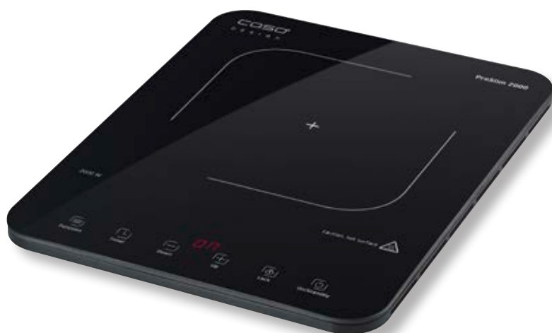
Piano cottura induzione ProSlim 2000