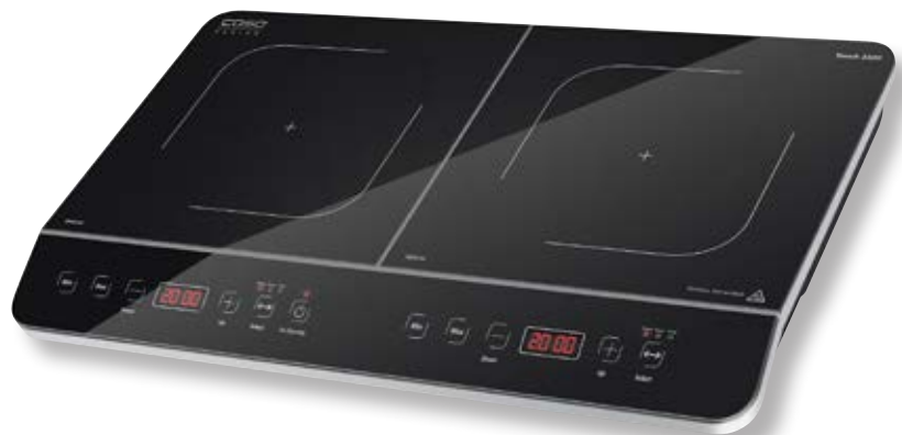
Piano cottura induzione Touch 3500