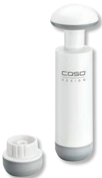
Set pompa per sottovuoto con adattatore CSO 01178