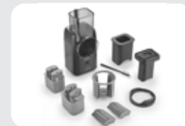
Tritacarne FW 2000 - Fleischwolf