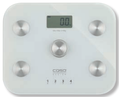
Bilancia pesapersona BodyEnergy Fit