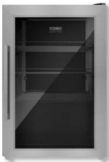
Frigorifero BBQ Cooler S-R CSO 00700