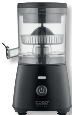
Spremiagrumi CP 400 Lift