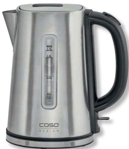
Bollitore Classico WK 2200