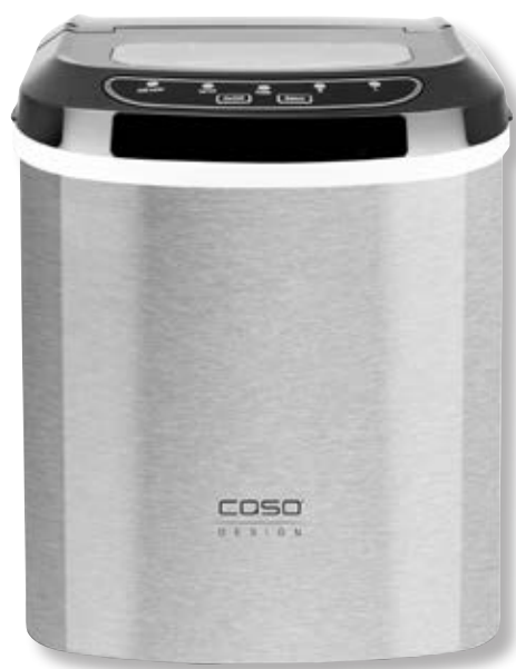
Macchina del ghiaccio IceMaster Pro