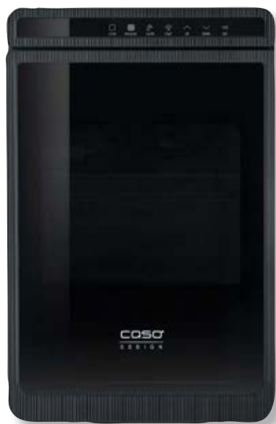
Macchina per il ghiaccio Ice Cube Pro