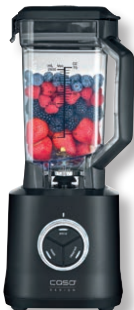
Frullatore B 2000