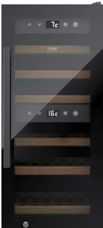
Cantina frigo WineExclusive 24 Smart