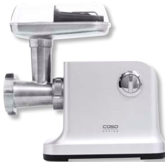
Tritacarne FW 2000 - Fleischwolf