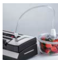
Barra per sottovuoto VRH 790 advanced Pro