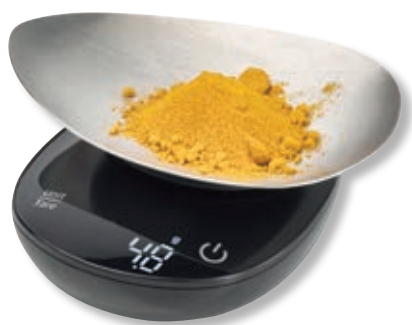
Bilancia da cucina FinoCompact