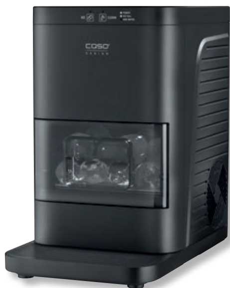
Macchina per il ghiaccio Ice Ball Pro