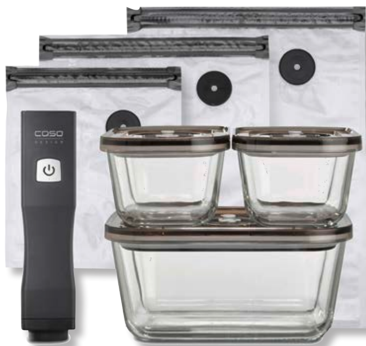
Set sottovuoto OneTouch Eco CSO 01169