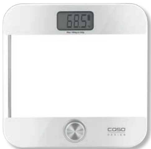
Bilancia pesapersona Body Energy Ecostyle