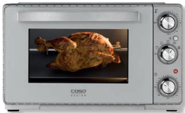
Fornetto elettrico TO 26 SilverStyle