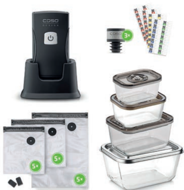
Set sottovuoto OneTouch Pro CSO 01336