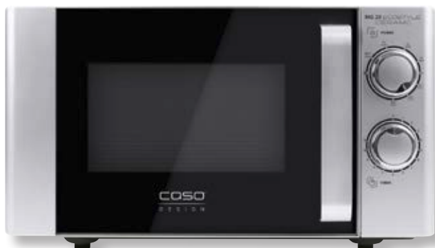
Forno a microonde MG 20 Ecostyle Ceramic