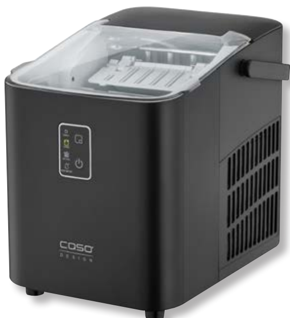
Macchina del ghiaccio IceChef Compact