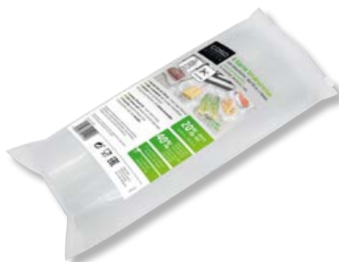
Confezione 2 rotoli goffrato 4-Stars