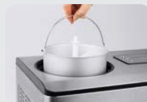
Macchina del ghiaccio IceMaster Pro