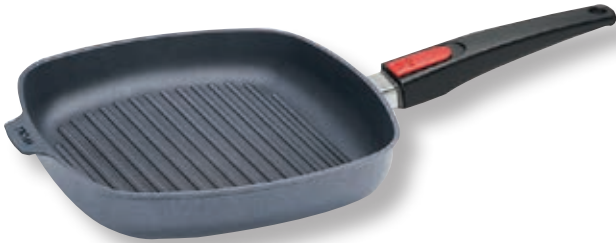
Diamond Lite Bistecchiera