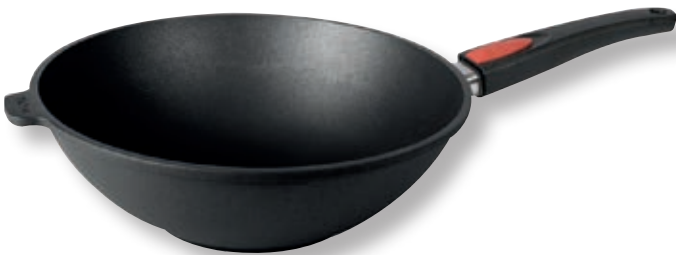
Titan Best wok