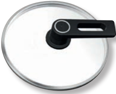
Coperchio Smart Tondo