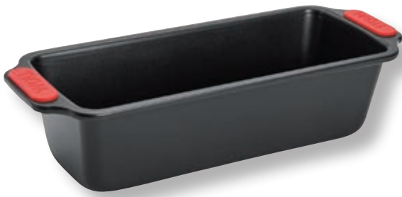
Stampo per pane WLL WB03