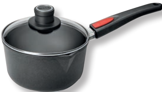
Titan Best Casseruola