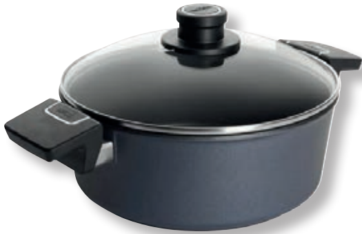
Diamond Lite Casseruola Tonda WLL 824DPI