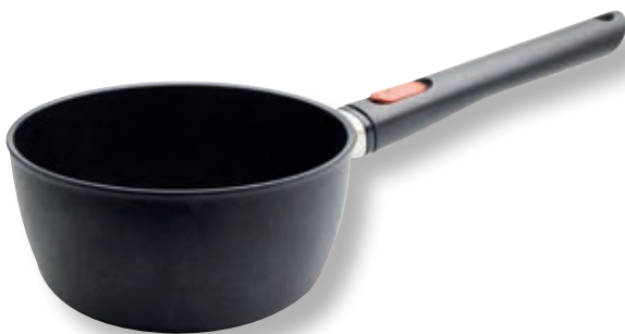
Eco Lite QXR Casseruola