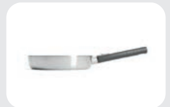
Logic Steel Padella Alta WLL 172 ..

Padella alta ultra resistente in alluminio e acciaio inox, adatta a tutti i tipi di cucine.