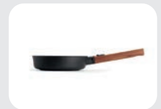
Eco Logic QXR Padella Alta WLL 172..

Padella alta antiaderente in alluminio, adatta a tutti i tipi di cucine. Il rivestimento antiaderente Saphir è perfetto per cucinare senza grassi e ideale per un'alimentazione più sana.