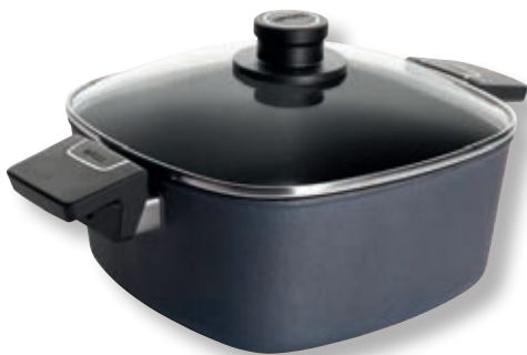
Diamond Lite Casseruola Quadrata con Coperchio