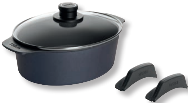
Diamond Lite Casseruola Alta con Coperchio