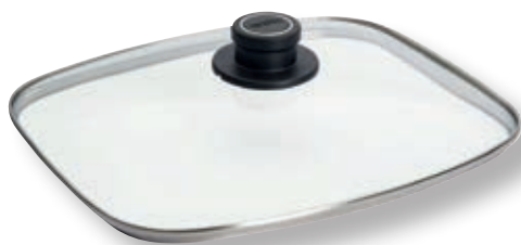
Coperchio Universale Rettangolare