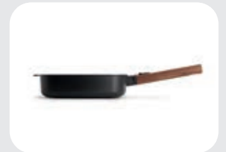
Eco Logic QXR Wok