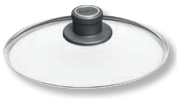
Coperchio Universale Tondo