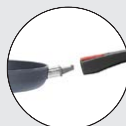
SEMPLICE E PRATICO