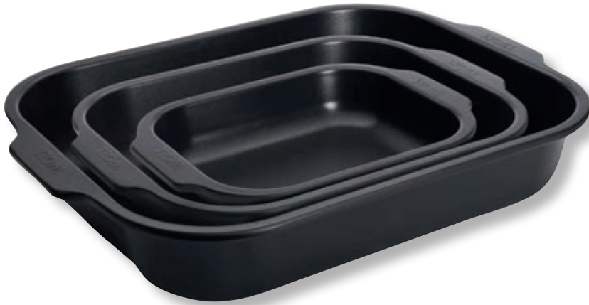
Set tre pirofile da forno WLL WB-SET004