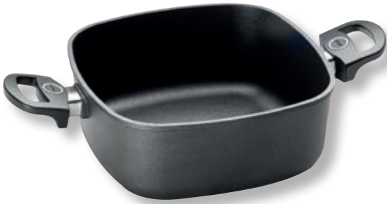
Titan Best Casseruola Quadrata