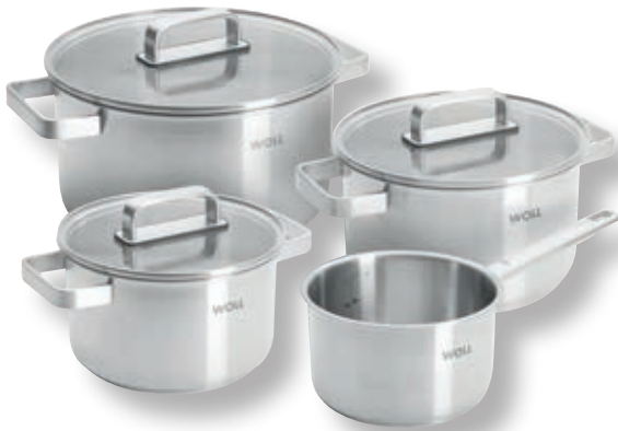
Steel - Set 7 pezzi