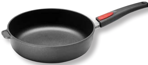
Titan Best Padella Alta