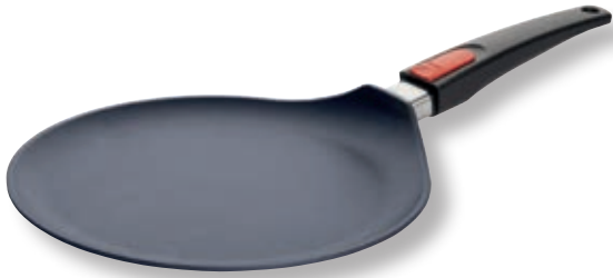
Diamond Lite Crepiera