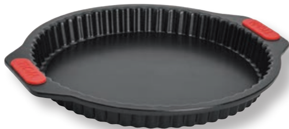
Stampo per quiche