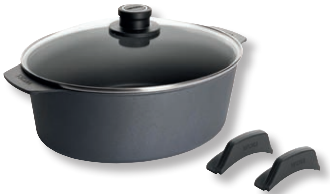
Diamond Lite Casseruola Alta con Coperchio