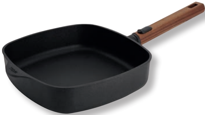
Eco Logic QXR Padella Quadrata Alta