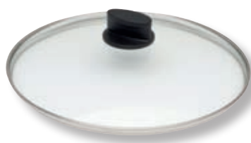
Coperchio Eco Lite