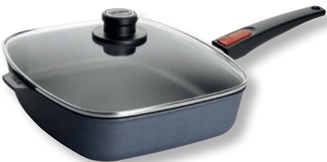
Diamond Lite Padella Rettangolare con Coperchio