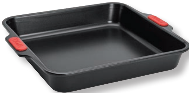
Stampo quadrato WLL WB09