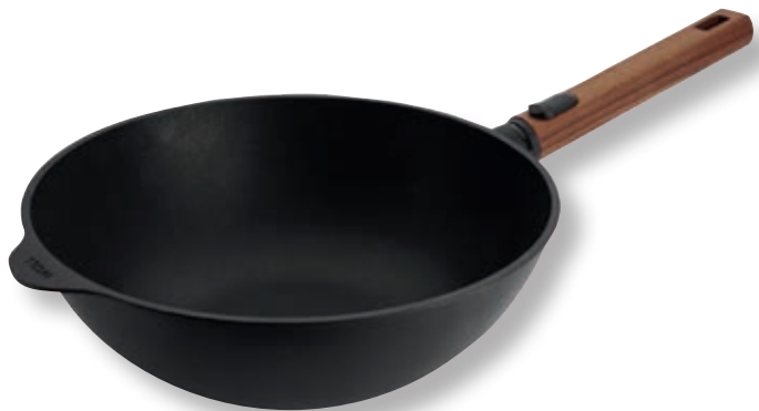
Eco Logic QXR Wok