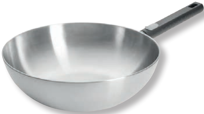
Logic Steel Wok WLL 11030LCS