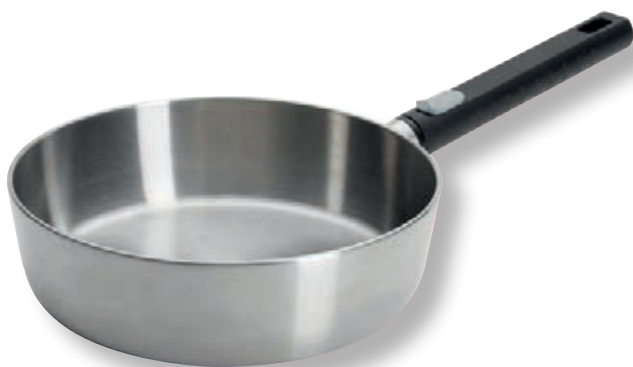
Logic Steel Padella Alta WLL 1724LCS