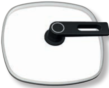
Coperchio Smart Quadrato