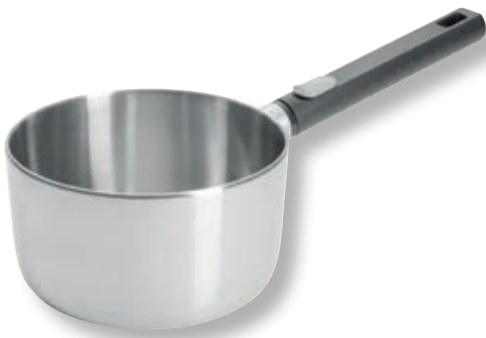
Logic Steel Casseruola WLL 1118LCS