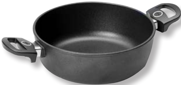
Titan Best Cassereuola Tonda