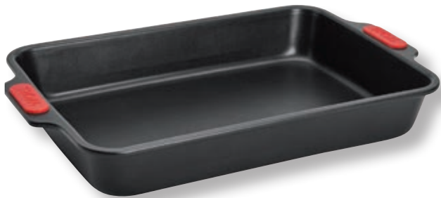
Stampo rettangolare WLL WB01