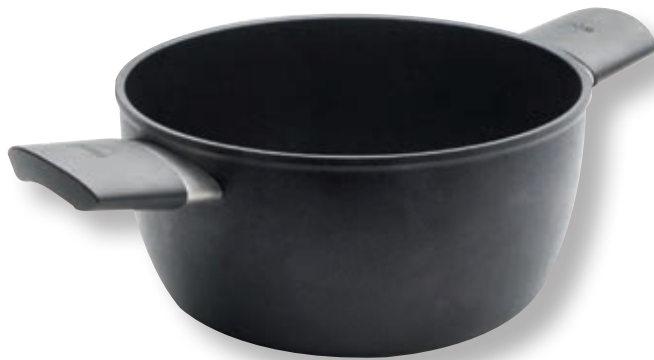
Eco Lite QXR Pentola