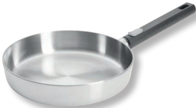
Logic Steel Padella Bassa WLL 1520LCS