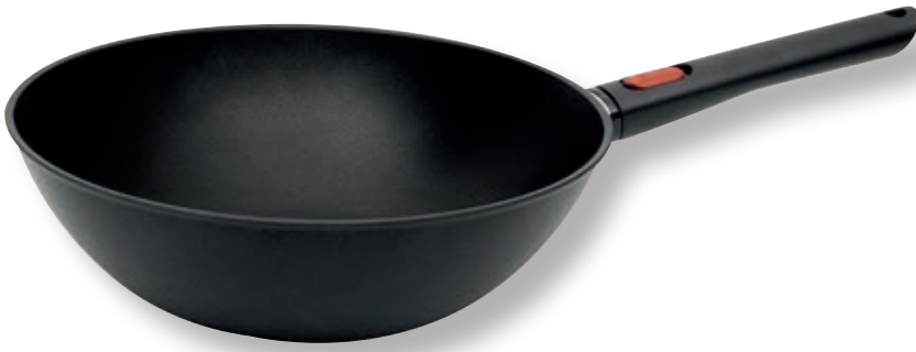
Eco Lite QXR Wok