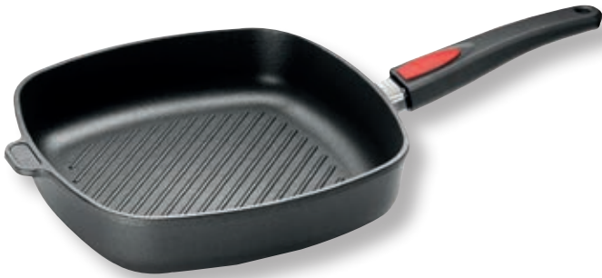
Titan Best bistecciera