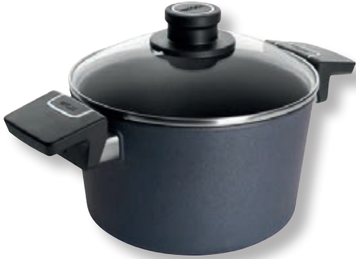
Diamond Lite Pentola con Coperchio WLL 120DPIL