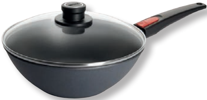
Diamond Lite Wok con Coperchio