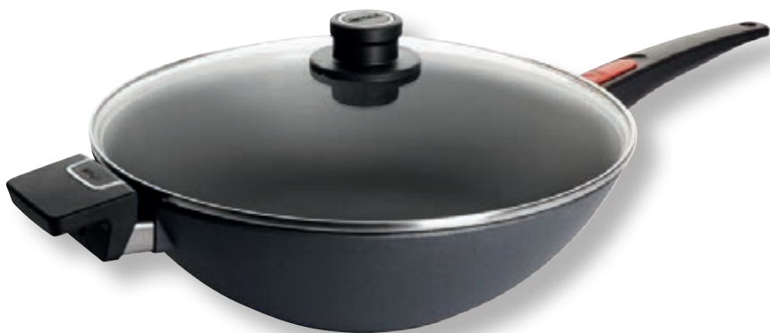
Diamond Lite Wok WLL 11034DPIL