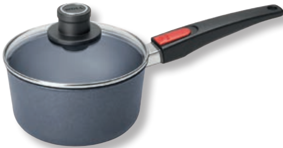
Diamond Lite Casseruola con Coperchio