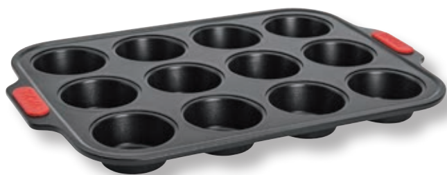
Teglia per muffin