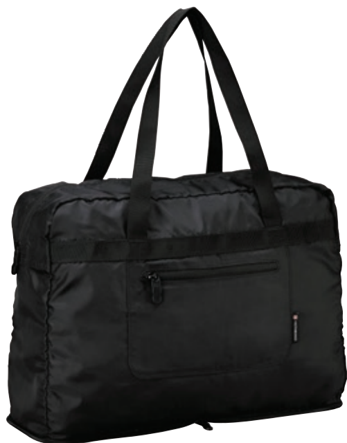
Borsa pieghevole VTG 31375001