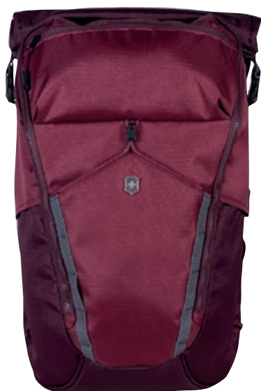
Deluxe Rolltop Laptop Backpack

Stile e sostanza si uniscono nella gamma di zaini Victorinox Altmont Active, progettati per garantire lo stesso livello di funzionalità nell'ambiente urbano e nelle avventure quotidiane.