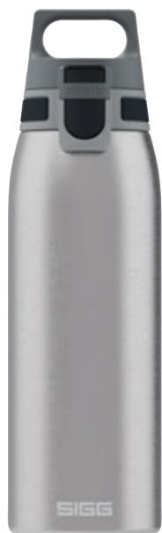
Shield One Brushed