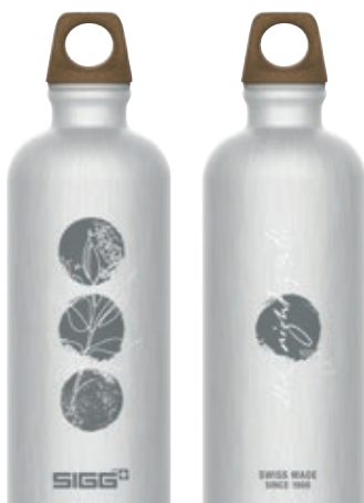
Traveller MyPlanet Path SI 6002.40