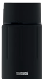
Gemstone Food Jar Obsidian SI GEM75 FJ BK