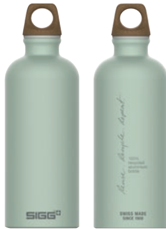
Traveller MyPlanet Repeat Plain SI 6002.70 • Capacità: 0,6 lt