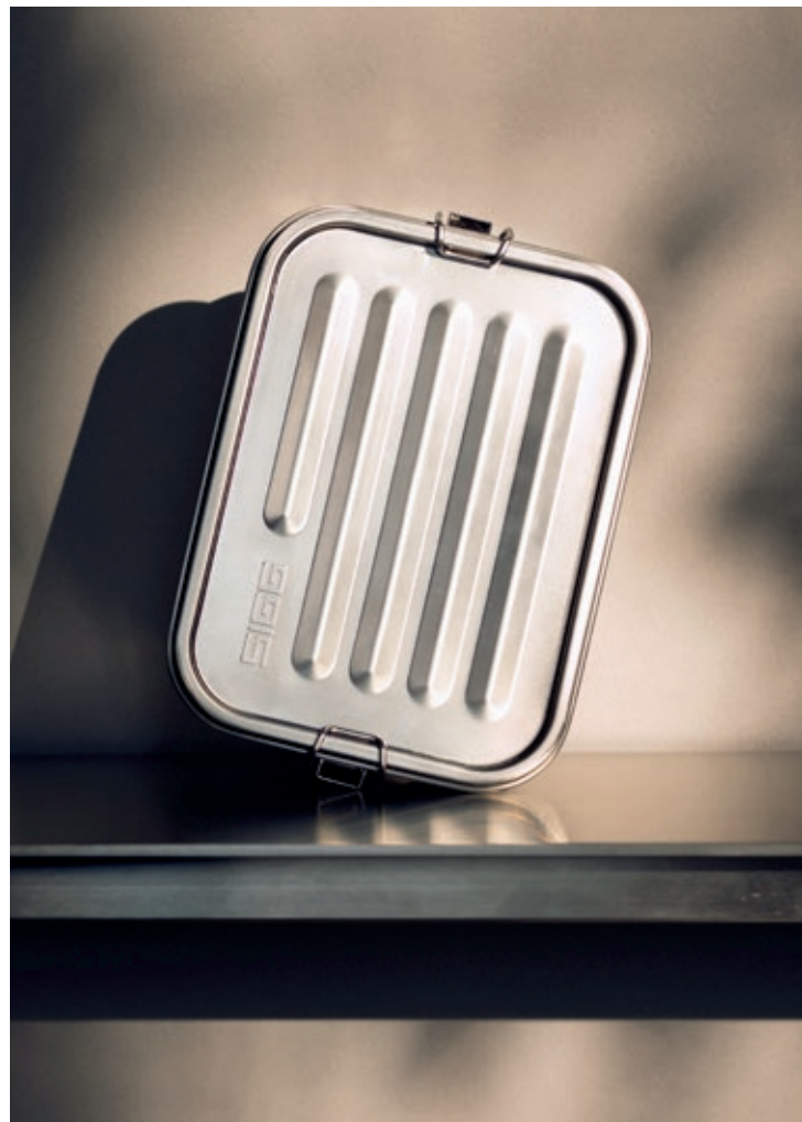
Gemstone Lunchbox Selenite SI 8733.40 Portavivande Gemstone • Dimensioni: 20,5 x 6,8 cm • Peso: 390 gr