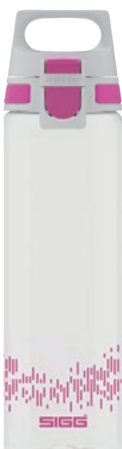
Total Clear One MyPlanet™ SI 8950.90 • Colore: berry