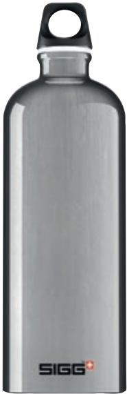
Traveller Alu SITC100.06 • Capacità: 1 lt