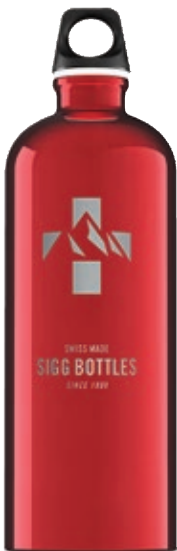
Mountain Red SI TC100M.02 • Capacità: 1 lt