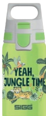
Jungle SI 9000.80 • Capacità: 0,5 Lt