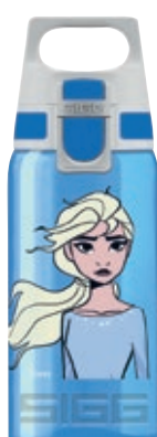
Elsa SI 8869.60 • Capacità: 0,5 Lt