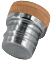
SI 9000.30 • Tappo per Sigg Meridian