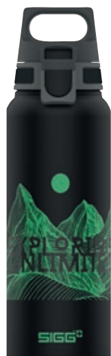
WMB Pathfinder Black SI 9026.20 • Capacità: 1 Lt