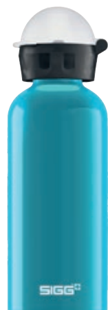
KBT Waterfall SI K40.57