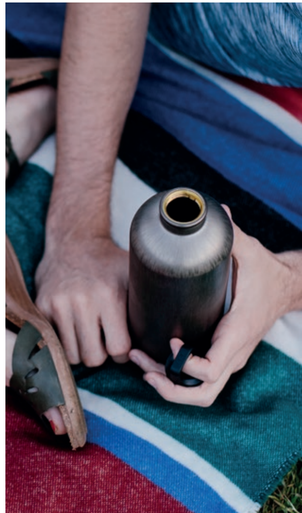
Traveller Smoked Pearl SITC60.06 Bottiglia Traveller. • Capacità: 0,6 lt