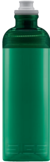
Feel Green SI SX GR