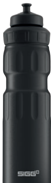
WMB Sports Black Touch SI WMS.03 • Capacità: 0,75 lt

WMB Sports è la bottiglia adatta a chi pratica sport. Alluminio di alta qualità, ultra leggera e robusta. L'ampia apertura facilita l'inserimento della bevanda, del ghiaccio e ne rende semplice la pulizia. Coloratissime e allegre hanno una superficie aderente ed ergonomica per una facile presa.