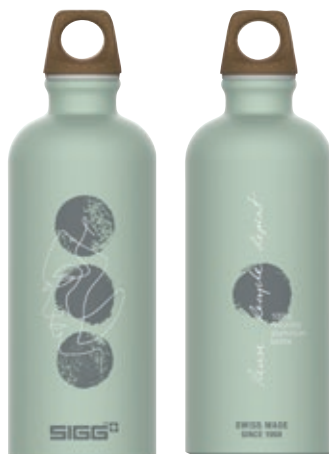
Traveller MyPlanet Repeat SI 6002.10