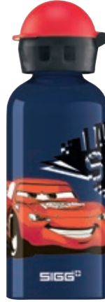
Cars Speed SI K40D.11