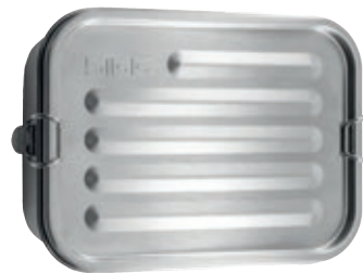
Gemstone Lunchbox Selenite SI 8733.40