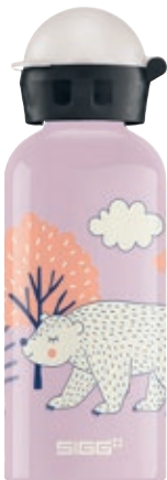
Beary SI 8923.50