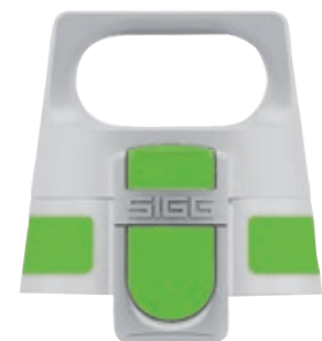
SI VONE TP GR • Tappo Viva One.