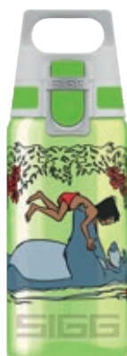
Jungle Book SI V500NE.09 • Capacità: 0,5 Lt