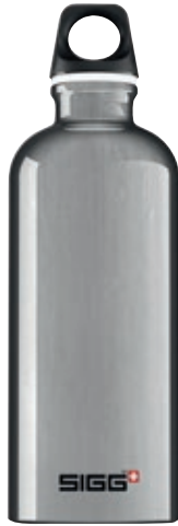
Traveller Alu SITC60.05 • Capacità: 0,6 lt