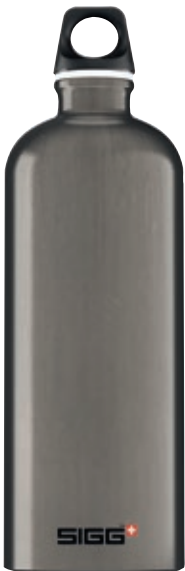
Traveller Smoke SITC100.03 • Capacità: 1 lt