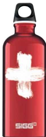
Swiss Red SI TC60.23 • Capacità: 0,6 lt