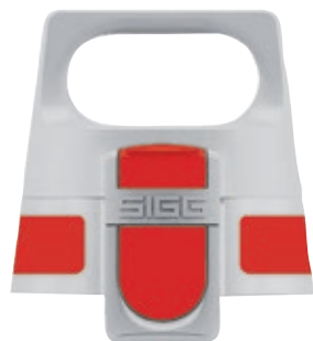
SI VONE TP RD • Tappo Viva One.