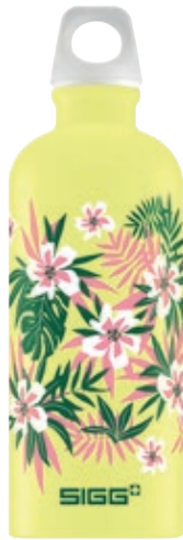
Florid Ultra Lemon Touch SI TC60TF.02 • Capacità: 0,6 lt

Aluminium Lucid Touch: alluminio di alta qualità e colori brillanti.