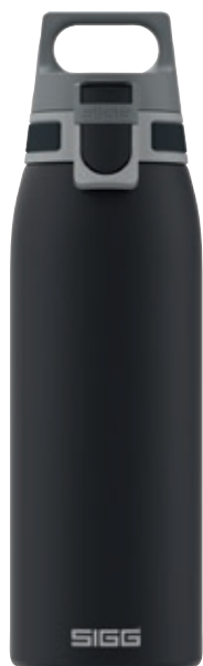
Shield One Black