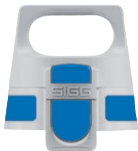
SI VONE TP BL • Tappo Viva One.