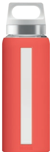
Dream Scarlet SI DR65.03 • Capacità: 0,65 lt

La linea Dream presenta un'apertura sul collo molto ampia, ideale per portare con sé anche succhi e smoothies.