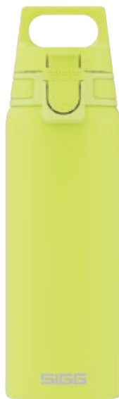
Shield One Ultra Lemon