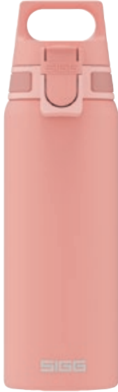
Shield One Shy Pink