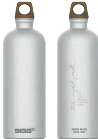
Traveller MyPlanet Path Plain SI 6003.60 • Capacità: 1 Lt