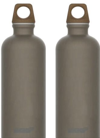
Traveller MyPlanet Lighter Plain SI 6002.90 • Capacità: 0,6 lt