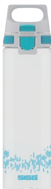
Total Clear One MyPlanet™ SI 8951.10 • Colore: acqua