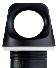
SI 7815.12 • Tappo Traveller.