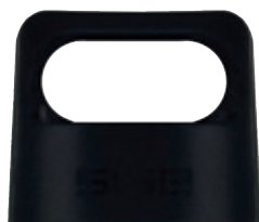
SI 8818.90 • Tappo per Explorer