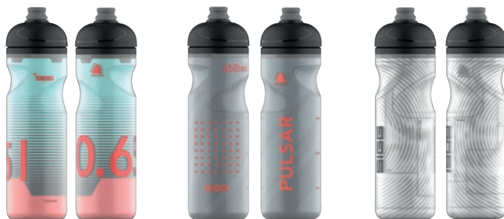
Pulsar Therm Frost SI 6005.50 • Capacità: 0,65 Lt