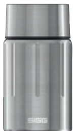
Gemstone Food Jar Selenite SI GEM75 FJ SV • Capacità: 0,75 lt