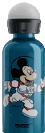
Mickey Astronaut SI 6059.10 • Capacità: 0,4 Lt

Bottiglia Kids SI 8489.60 • Capacità: 0,4 Lt