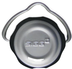
SI 8202.00 • Tappo Retrò