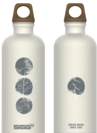
Traveller MyPlanet Forward SI 6002.20