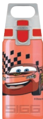
Cars SI V500NE.10 • Capacità: 0,5 Lt