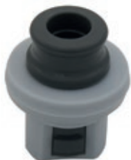
SI 8638.10 • Beccuccio per adattatore Hero