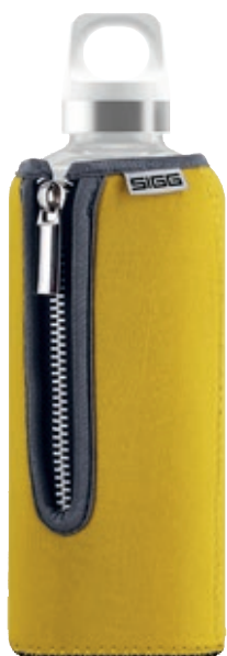
Stella Yellow SI STL.02 • Capacità: 0,5 lt