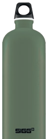
Leaf Green Touch SI TC100T.15 • Capacità: 1 lt