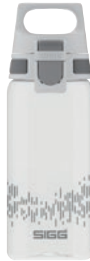
Total Clear One MyPlanet™ SI 8951.70