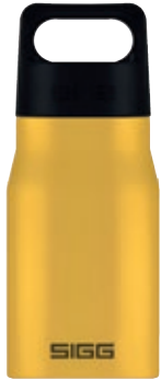
Explorer Mustard SI EXP55.05 • Capacità: 0,55 lt