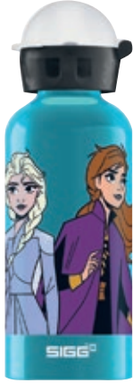
Anna e Elsa SI 8869.50