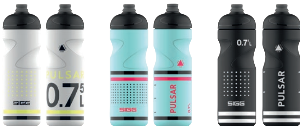
Pulsar White SI 6005.80 • Capacità: 0,75 Lt