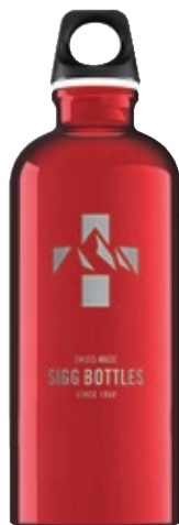
Mountain Red SI TC60M.02 • Capacità: 0,6 lt