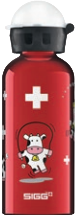
Funny Cows SI K40.55