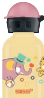
Fantoni SI K30.34