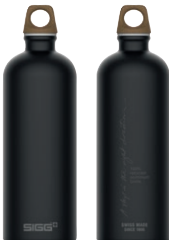
Traveller MyPlanet Direction Plain SI 6003.70 • Capacità: 1 Lt