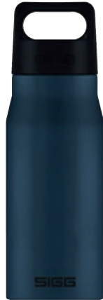
Explorer Dark SI EXP75.01 • Capacità: 0,75 lt