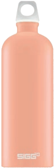
Shy Pink Touch SI TC100T.12 • Capacità: 1 lt