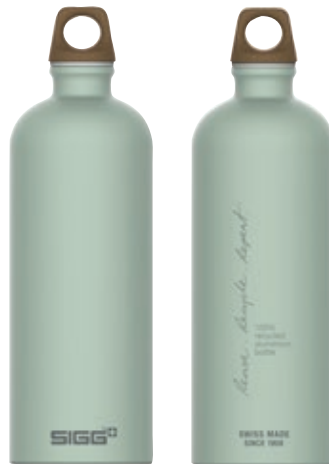
Traveller MyPlanet Repeat Plain SI 6003.30 • Capacità: 1 Lt