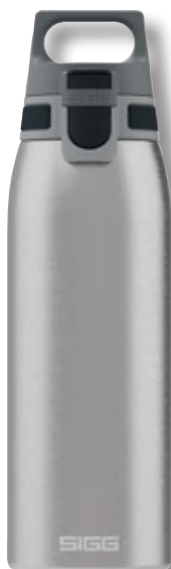
Shield One Brushed