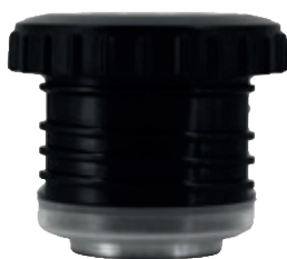
SI 8804.20 • Per Gemstone 1 lt