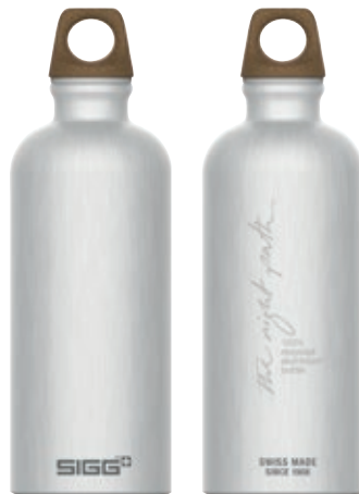
Traveller MyPlanet Path Plain SI 6003.00 • Capacità: 0,6 lt