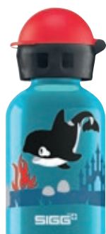
Orca Family SI K30.24