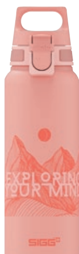
WMB Pathfinder Shy Pink SI 9026.10 • Capacità: 1 Lt

La nuova bottiglia Pathfinder in alluminio riciclabile è nata dalla passione per il design, la funzionalità e le avventure all'aperto. Il materiale è privo di sostanze chimiche nocive, come il BPA, estrogeni e ftalati. La bottiglia è a prova di perdite anche con bevande gassate. Inoltre, l'innovativo tappo ONE top rende la bottiglia particolarmente comoda per l'apertura e la chiusura con una sola mano.