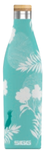
Meridian Sumatra Birds SI 8970.90 • Capacità: 0,5 lt