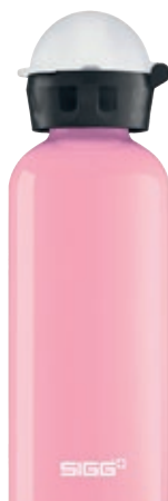
KBT Icecream SI K40.58