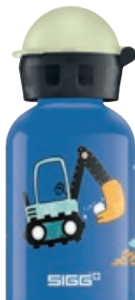
Build It SI 9001.90