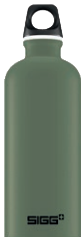
Leaf Green Touch SI TC60T.15 • Capacità: 0,6 lt