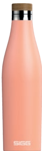
Meridian Shy Pink SI 8999.40 • Capacità: 0,5 lt

Sigg Meridian è un accessorio indispensabile per chi ama l'eleganza e il design raffinato, la soluzione perfetta per le attività quotidiane. La bottiglia è in acciaio inossidabile 18/8 a doppia parete. Riesce a mantenere la temperatura di qualsiasi bevanda (sia calda che fredda) per ore grazie al rivestimento interno in rame che garantisce un'ottima prestazione di isolamento. Il tappo è realizzato in pregiato bambù. Tutti i materiali sono privi di sostanze nocive.