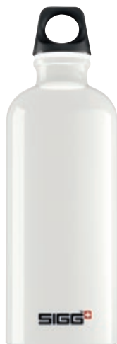
Traveller White SI TC60.06 • Capacità: 0,6 lt