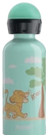
Simba Roar SI 6059.00 • Capacità: 0,4 Lt