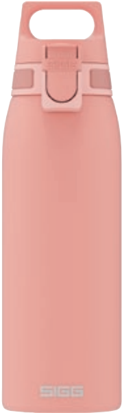
Shield One Shy Pink