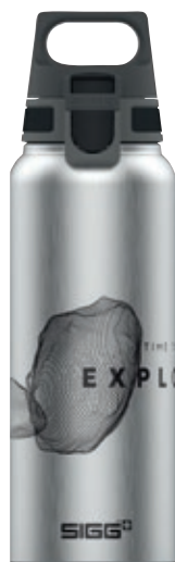
WMB Pathfinder Alu SI 9026.00 • Capacità: 1 Lt