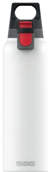
Hot&Cold One Light White SI 8998.30 • Capacità: 0,5 lt