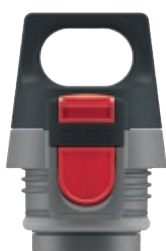
SI H&CT GY • Tappo grigio per Hot&Cold One