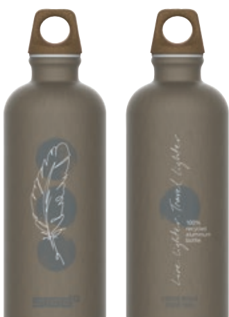
Traveller MyPlanet Lighter SI 6002.30