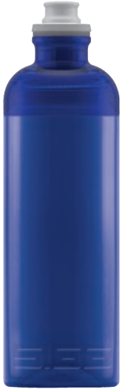
Feel Blue SI SX BL