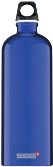
Traveller Blue SI TC100.02 • Capacità: 1 lt