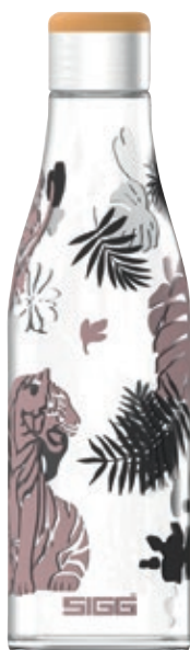
Metis Tiger SI 8971.80