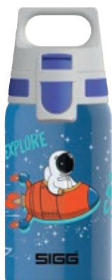
Space SI 9000.60 • Capacità: 0,5 Lt

Le bottiglie Shield One sono in acciaio inossidabile robuste e prive di sostanze nocive, adatte a bambini di tutte le età.