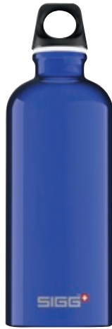
Traveller Blue SI TC60.02 • Capacità: 0,6 lt