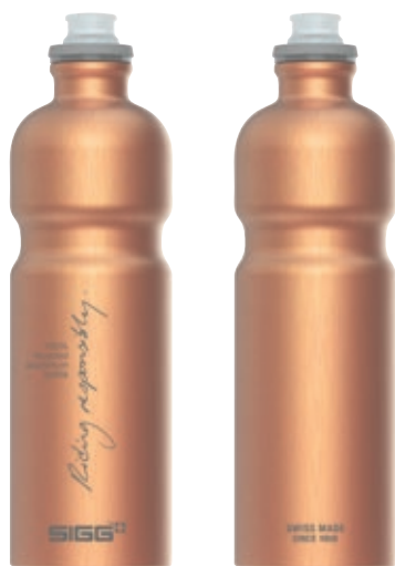
Move MyPlanet Copper SI 6006.20 • Capacità: 0,75 Lt