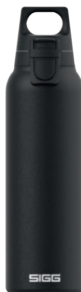
Hot&Cold One Light Black SI 8998.10 • Capacità: 0,5 lt