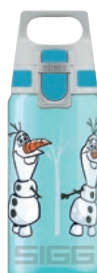
Olaf SI 8869.70 • Capacità: 0,5 Lt