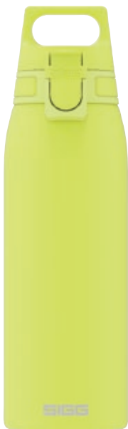
Shield One Ultra Lemon