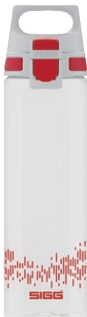
Total Clear One MyPlanet™ SI 8951.30 • Colore: red