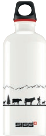
Swiss Craft SI TC60D.22 • Capacità: 0,6 lt

Ogni bottiglia SIGG è un pezzo di alto artigianato svizzero da oltre 100 anni. Un risultato che SIGG desidera onorare con questa serie Swiss Culture.