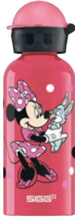
Minnie Mouse SI K40D.26