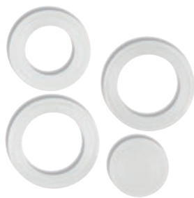
Set Guarnizioni SI 8833.80