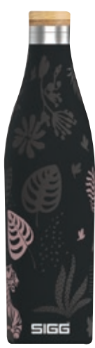
Meridian Sumatra Tiger SI 8971.20 • Capacità: 0,5 lt