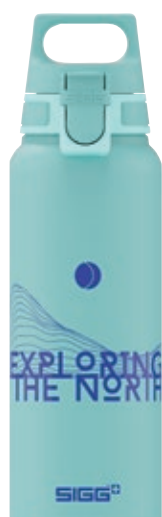
WMB Pathfinder Glacier SI 9025.90 • Capacità: 1 Lt