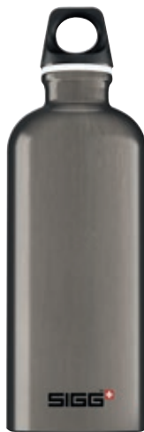
Traveller Smoke SITC60.03 • Capacità: 0,6 lt