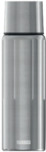
Gemstone IBT Selenite SI GEM110 IBT SV • Capacità: 1 lt