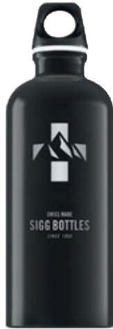
Mountain Black SI TC60M.01 • Capacità: 0,6 lt