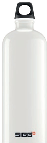
Traveller White SI TC100.04 • Capacità: 1 lt