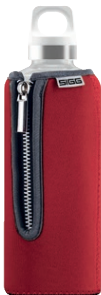
Stella Red SI STL.03 • Capacità: 0,5 lt

La linea Stella, in vetro borosilicato è resistente al calore. Protetta da un rivestimento in tessuto che si può rimuovere con una pratica zip.