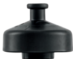
SI 7815.11 • Tappo per WMB Sports.