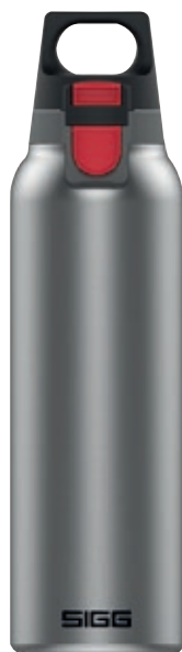
Hot&Cold One Light Brushed SI 8998.20 • Capacità: 0,5 lt