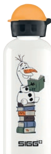
Olaf SI 8862.10