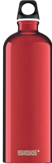
Traveller Red SI TC100.01 • Capacità: 1 lt