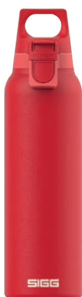
Hot&Cold One Light Scarlet SI 8998.00 • Capacità: 0,5 lt

Sottile, chic e pratica. 10% più leggera e voluminosa rispetto alla versione precedente. La bottiglia in acciaio inossidabile 18/8 di alta qualità è isolata e crea il sotto vuoto per mantenere le bevande calde fino a 13 ore o fredde fino a 30 ore! Il filtro per il tè incorporato è perfetto per usare foglie di tè o piccoli pezzi di frutta, il cuscinetto antiscivolo sulla base mantiene la stabilità sul piano. La nuova Hot & Cold One Light è un'alternativa perfetta alle bottiglie e alle tazze da caffè usa e getta!