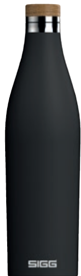
Meridian Black SI 8999.90 • Capacità: 0,7 lt