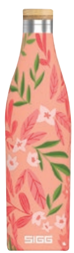
Meridian Sumatra Flowers SI 8970.80 • Capacità: 0,5 lt