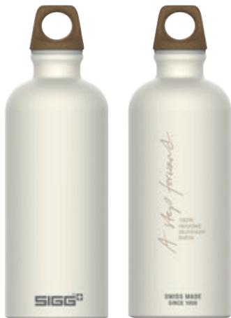
Traveller MyPlanet Forward Plain SI 6002.80 • Capacità: 0,6 lt