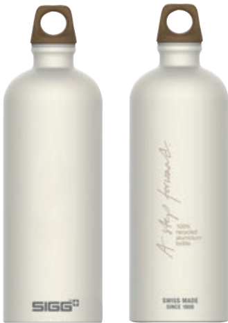
Traveller MyPlanet Forward Plain SI 6003.40 • Capacità: 1 Lt