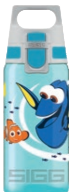
Dory SI V500NE.08 • Capacità: 0,5 Lt