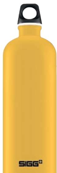
Mustard Touch SI TC100T.16 • Capacità: 1 lt

Traveller Touch è la nuova gamma colori opaca.