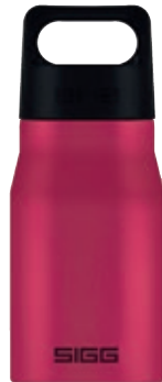
Explorer Deep Magenta SI EXP55.06 • Capacità: 0,55 lt

La bottiglia Explorer è adatta a tutte quelle persone che vedono la natura come la loro seconda casa. È facile da trasportare, estremamente resistente e dotata di una singola parete in acciaio inossidabile. L'Explorer è disponibile in tre diverse capacità e sei diversi colori.