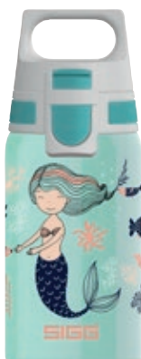
Atlantis SI 9000.70 • Capacità: 0,5 Lt