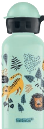
Jungle TZZ SI 8923.60