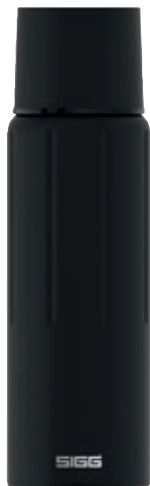
Gemstone IBT Obsidian SI GEM110 IBT BK