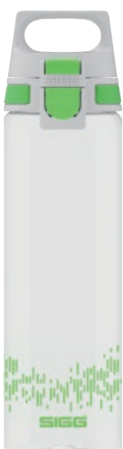
Total Clear One MyPlanet™ SI 8951.20 • Colore: green

Total Clear One MyPlanet™ SI 8951 .. Bottiglia trasparente in Tritan (BPA Free) con tappo WMB dal facile utilizzo con una singola mano. Grazie al tasto di bloccaggio integrato si riescono ad evitare le fuoriuscite accidentali. • Capacità: 0,75 lt