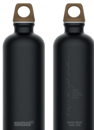
Traveller MyPlanet Direction Plain SI 6003.10 • Capacità: 0,6 lt