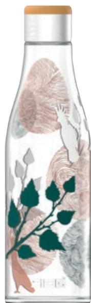
Metis Birds SI 8971.60