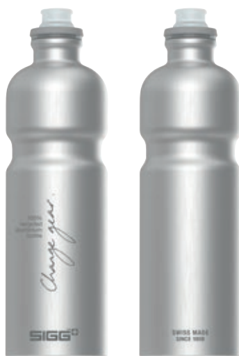
Move MyPlanet Alu SI 6006.30 • Capacità: 0,75 Lt