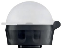
SI 8141.80 • Tappo per Sigg Kids