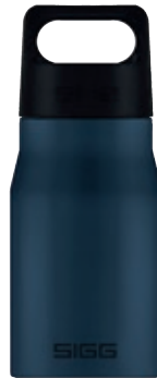
Explorer Dark SI EXP55.01 • Capacità: 0,55 lt