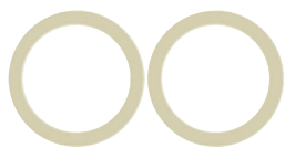
Guarnizioni SI 200