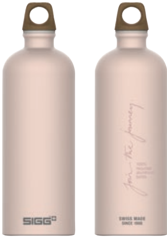
Traveller MyPlanet Journey Plain SI 6003.20 • Capacità: 1 Lt