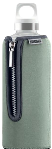
Stella Grey SI STL.01 • Capacità: 0,5 lt

Dream SI DR65.03 Bottiglia trasparente in vetro borosilicato e rivestimento in silicone (BPA Free). • Capacità: 0,65 lt