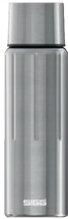
Gemstone IBT Selenite SI GEM75 IBT SV • Capacità: 0,75 lt