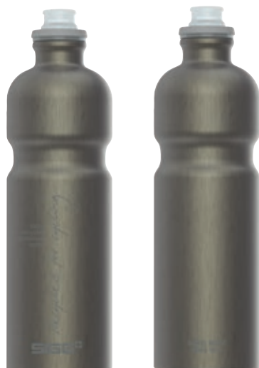
Move MyPlanet Smoked Pearl SI 6006.40 • Capacità: 0,75 Lt

La Move MyPlanet è realizzata in Svizzera con materiali di alta qualità realizzato in alluminio riciclato al 100% privo di BPA e di sostanze nocive. La soluzione della valvola SureSnap® integrata nel beccuccio garantisce risultati ottimali senza perdite anche in fase di apertura. L'utilizzo è estremamente semplice ed è facile aprire e chiudere la borraccia con la bocca.