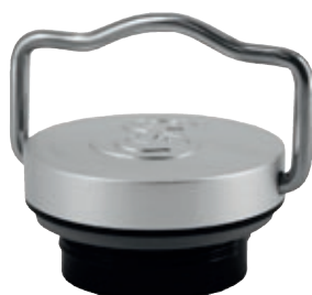
SI 8744.30 • Tappo per Original