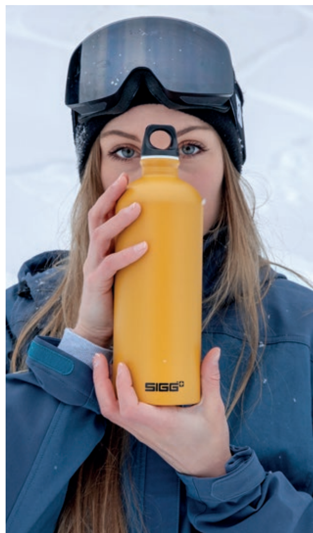
Traveller Touch SI TC100T.16 Bottiglia Traveller. • Capacità: 1 lt