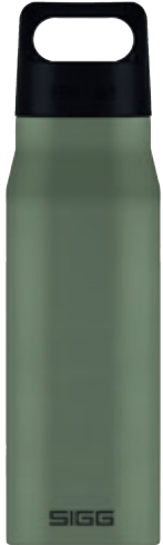
Explorer Leaf Green SI EXP100.03 • Capacità: 1 lt