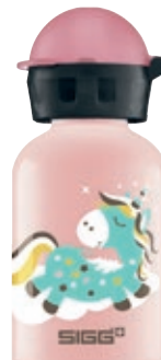
Fairycon SI K30.35