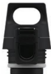
SI 8572.10 • Tappo nero per Hot&Cold One

Tappo per Sigg Gemstone IBT. Thermos da 1 Lt.