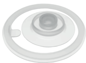
Set Guarnizioni WMB One 2 SI 6023.60

Blister con 4 guarnizioni per tappi di bottiglie Sigg Gemstone