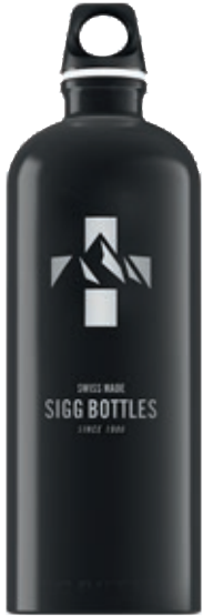
Mountain Black SI TC100M.01 • Capacità: 1 lt