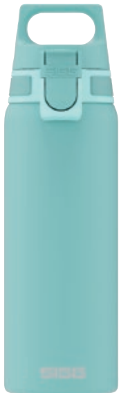
Shield One Glacier