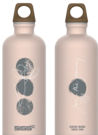
Traveller MyPlanet Journey SI 6002.00