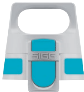
SI VONE TP LB • Tappo Viva One.