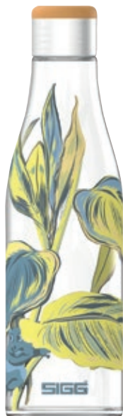
Metis Maki SI 8971.90