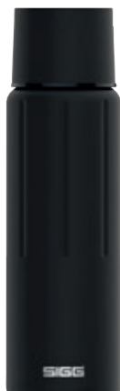
Gemstone IBT Obsidian SI GEM75 IBT BK