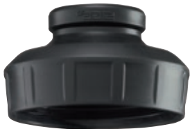
SI 8231.90 • Adattatore nero per WMB