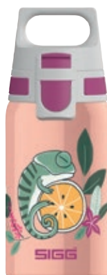
Flora SI 9000.90 • Capacità: 0,5 Lt

Bottiglia Kids SI 9000.. • Capacità: 0,5 Lt