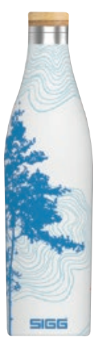
Meridian Sumatra Tree SI 8971.00 • Capacità: 0,5 lt