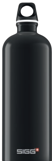
Traveller Black SI TC100.05 • Capacità: 1 lt