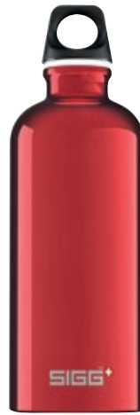
Traveller Red SI TC60.01 • Capacità: 0,6 lt

Traveller Blue SI TC100.02 Bottiglia Traveller. • Capacità: 1 lt