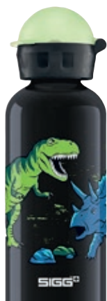
Dinosaurs SI 8489.60 • Capacità: 0,4 Lt