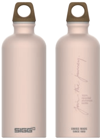
Traveller MyPlanet Journey Plain SI 6002.60 • Capacità: 0,6 lt