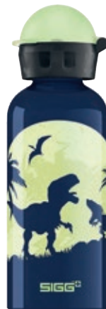
Glow Moon Dinos SI K40.14