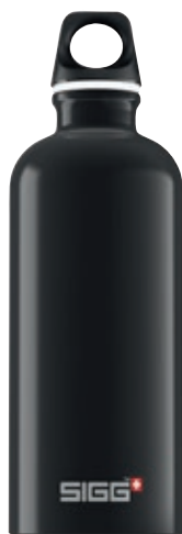
Traveller Black SI TC60.09 • Capacità: 0,6 lt

La bottiglia Traveller è l'unione perfetta di design alla moda e alluminio di alta qualità, riciclabile. Estremamente leggera e robusta, può essere portata con solo un dito. Ideale per chi viaggia. I materiali utilizzati sono privi di sostanze nocive.