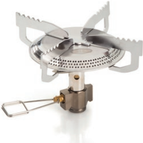
Fornelletto Glacier GSI 56004