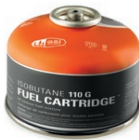
Isobutane 110G Fuel Cartridge GSI 56021