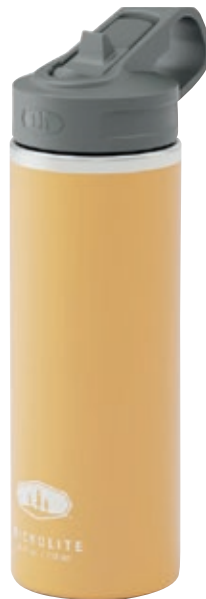
Thermos Microlite mineral