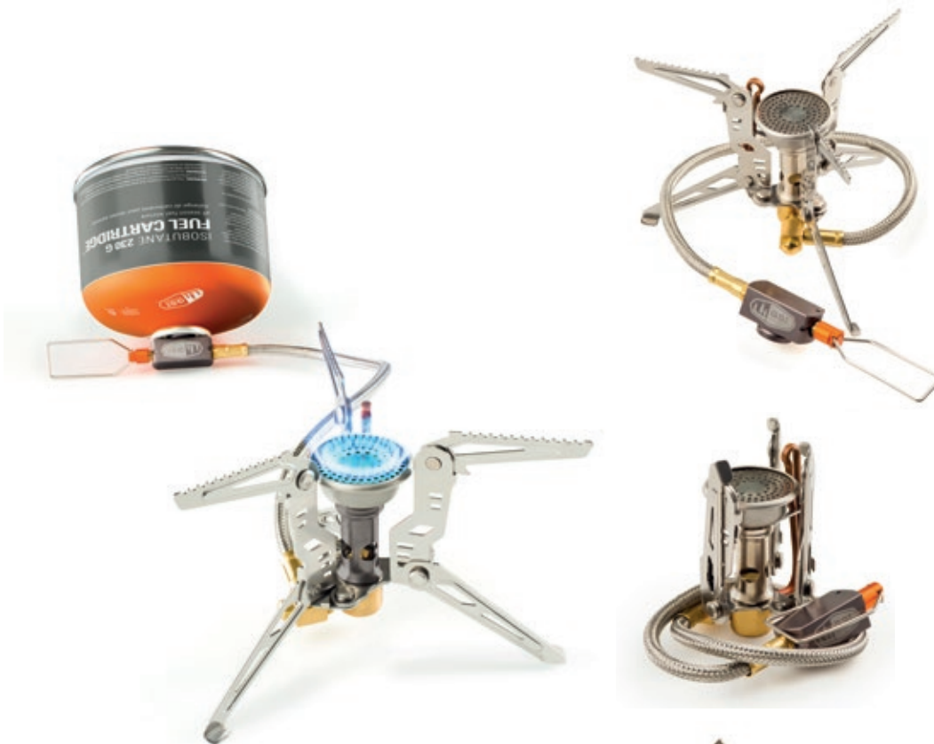
Pinnacle 4 Season Stove GSI 56003