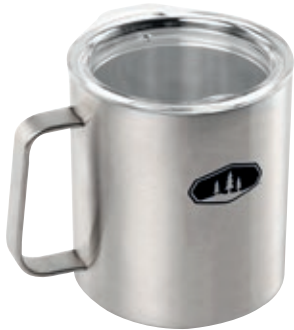
Tazza Glacier Stainless