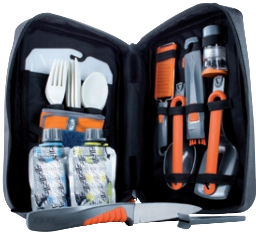
Kit Destination Kitchen GSI 90104