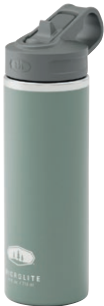
Thermos Microlite straw top