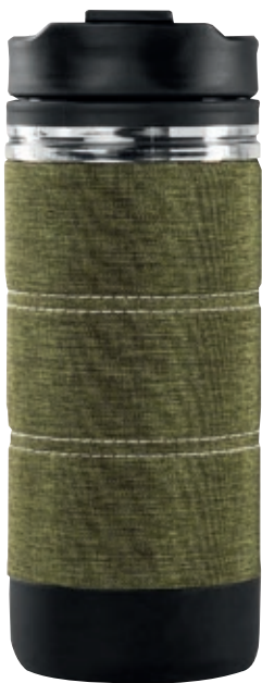
Tazza Java press GSI 79423