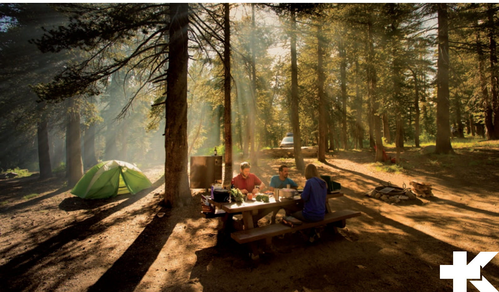
Halulite Ketalist GSI 50263