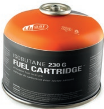
Isobutane 230G Fuel Cartridge GSI 56022