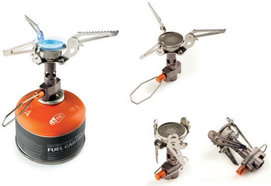
Pinnacle Canister Stove GSI 56002