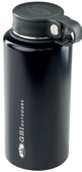
Thermos Microlight Twist GSI 67155