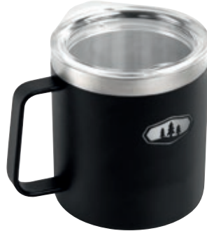
Tazza Glacier Stainless