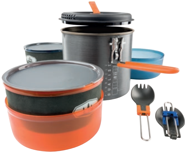
Set Pinnacle Dualist GSI 50247

Set Pinnacle Dualist GSI 50247 Set base da campo per due persone. Contenuto: - Pentola da 1,8 L - Coperchio pentola/colapasta - Due ciotole da 0,59 L - Due contenitori da 0,59 L - Due coperchi - Due posate pieghevoli - Sacco per il trasporto • Rivestimento: Teflon® Radiance technology • Materiali: rivestimento antiaderente, alluminio anodizzato duro, polipropilene trasparente, nylon 6-6 • Dimensione: 15 x 16,3 x 15 cm • Peso: 612 gr