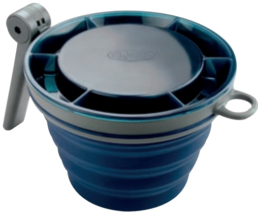
Tazza pieghevole Fairshare GSI 79202