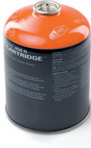
IsoButane 450G Fuel Cartridge GSI 56024