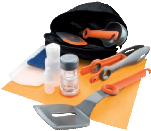
Kit Crossover Kitchen GSI 90102