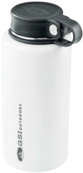
Thermos Microlight Twist GSI 67159