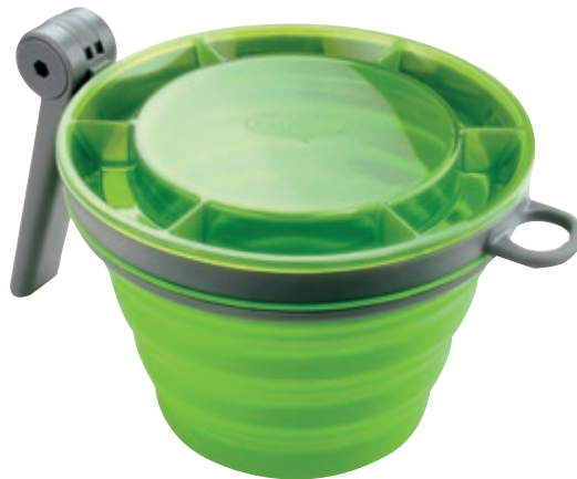
Tazza pieghevole Fairshare GSI 79203