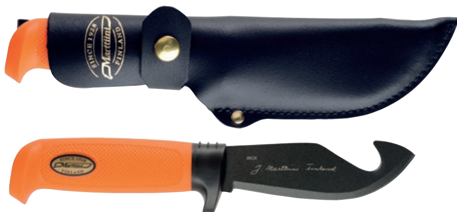
Coltello Scannare MT 378024T