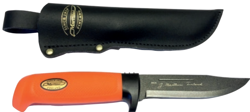
Big Game MT 390024T