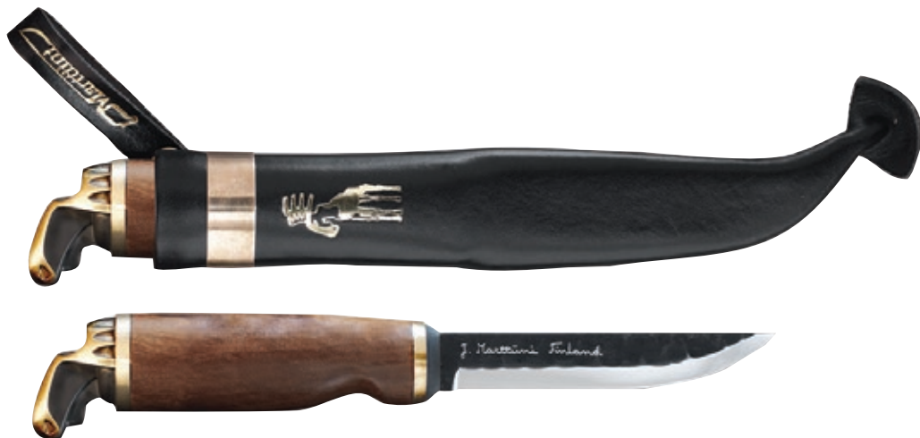
Antler MT 546012