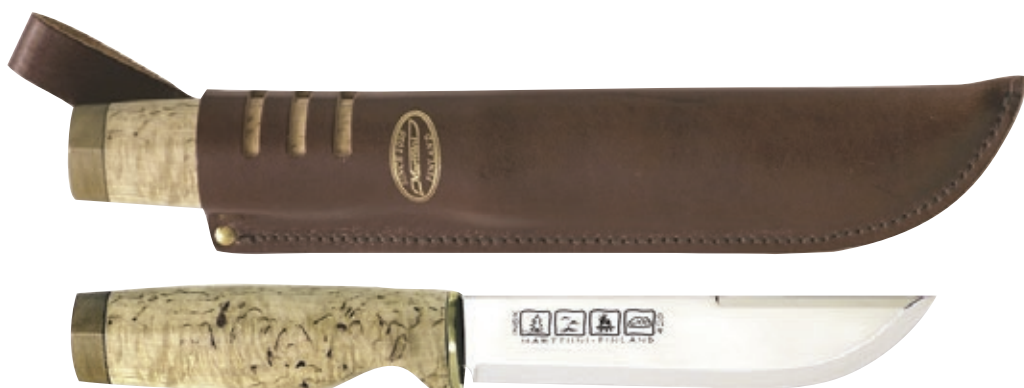
Ranger 250 MT 543015