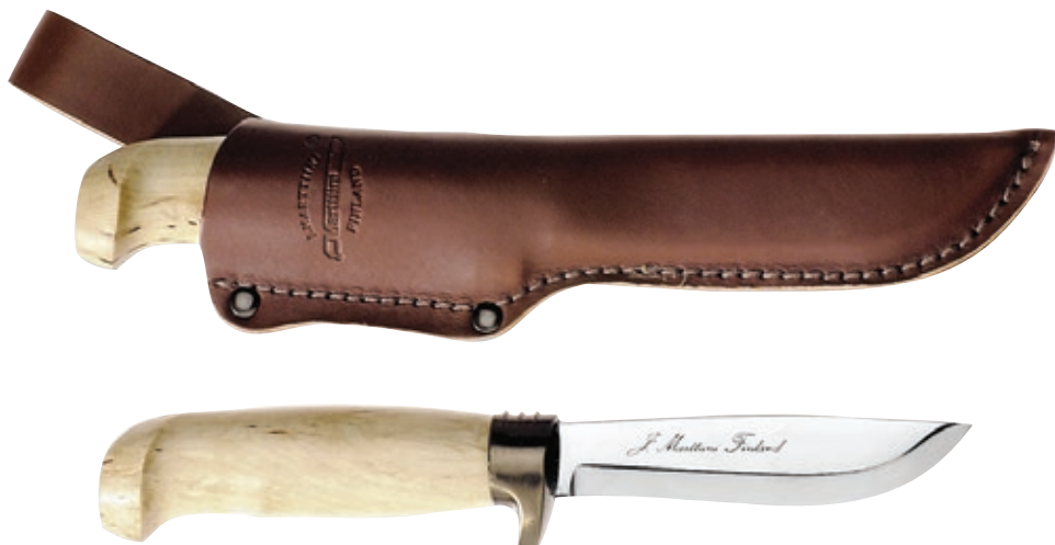
Condor Skinner Deluxe MT 167014