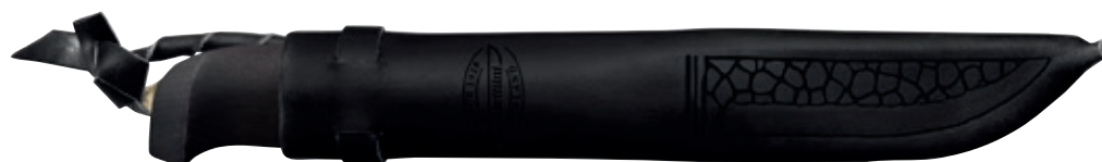
Lynx Black Edition