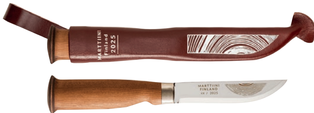
Lusto 2025 MT 235019C

Lusto è la parola finlandese e si riferisce agli anelli che indicano l'età di un albero all'interno del tronco. La forma ad anello è ripetuta nelle stampe e nella parte inferiore del manico. Il manico è realizzato in betulla trattata termicamente con olio trasparente per una maggiore protezione. Ogni coltello è numerato singolarmente.