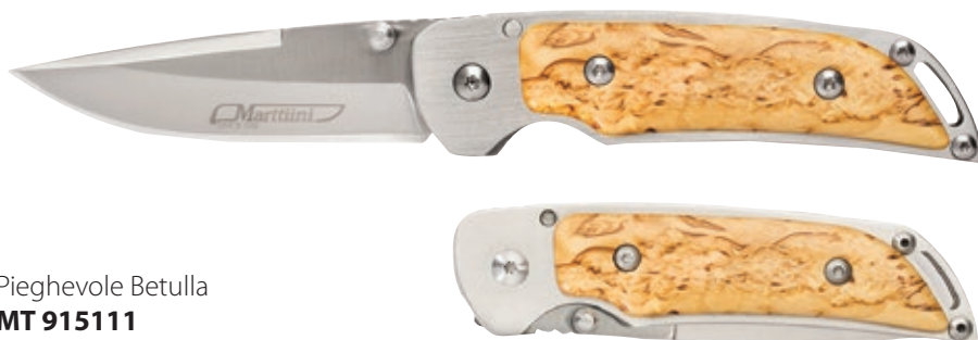
Pieghevole Betulla MT 915111