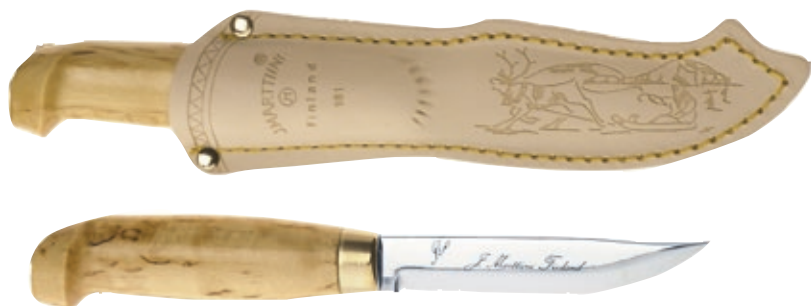
Lynx 131 MT 131010