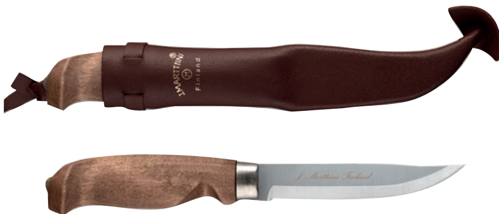
Lynx Lumberjack MT 127015