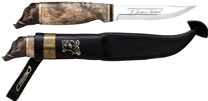
Wild Boar MT 546013