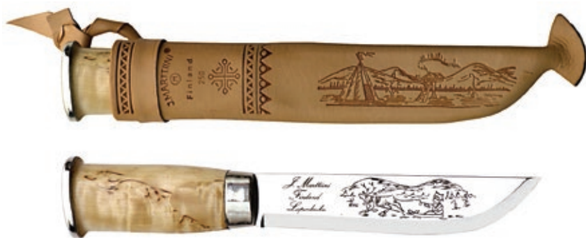
Lapp 250 MT 250010

La serie di coltelli tradizionali rispettano le caratteristiche, i decori e i materiali utilizzati nelle regioni artiche della Finlandia.