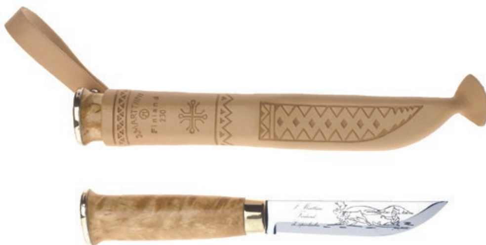
Lapp 230 MT 230010