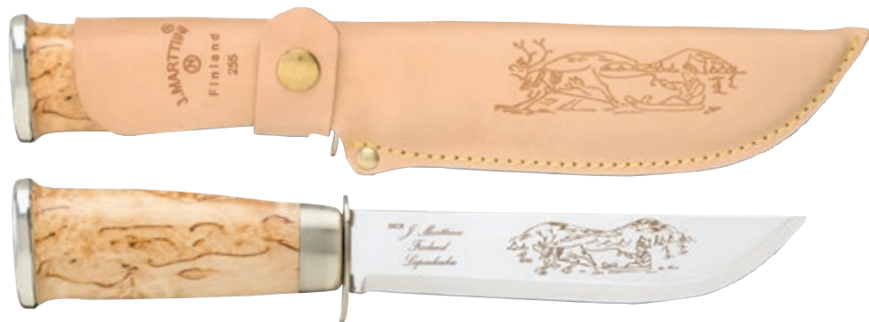
Lapp 255 MT 255010