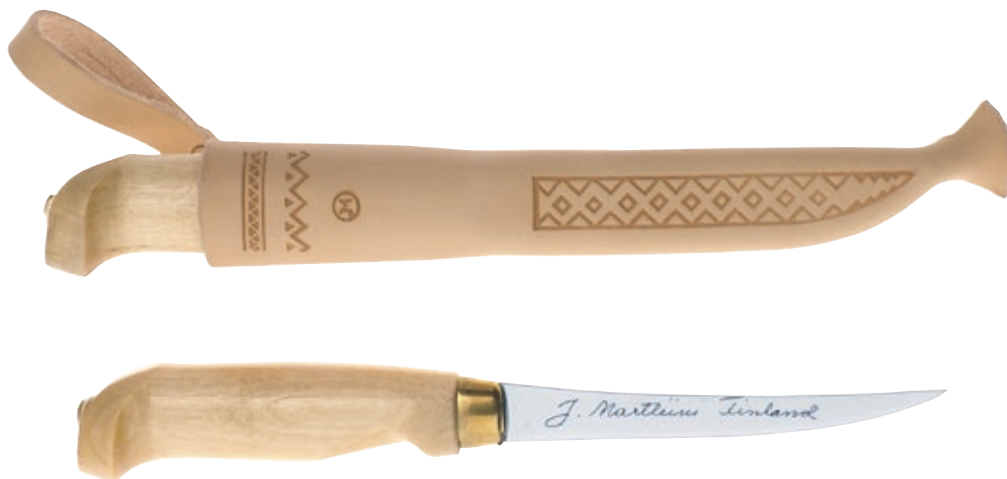
Classic 4" MT 610010