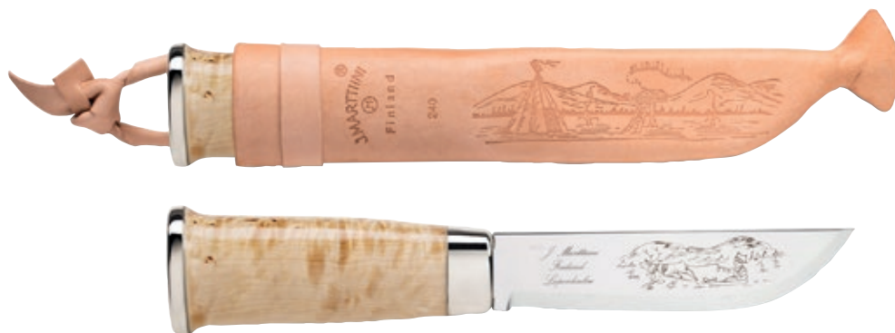
Lapp 240 MT 240010