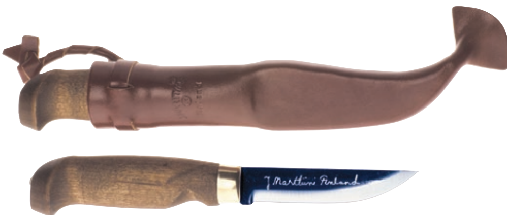
Lynx Lumberjack Carbon MT 127012