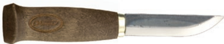
Black Lumberjack MT 127019