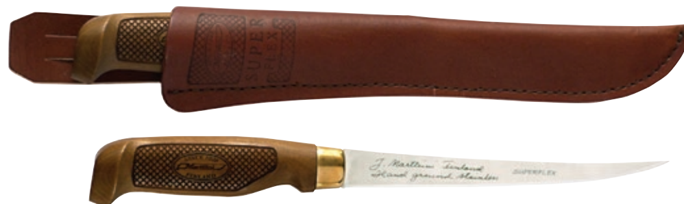
Classic Superflex 6" MT 620016