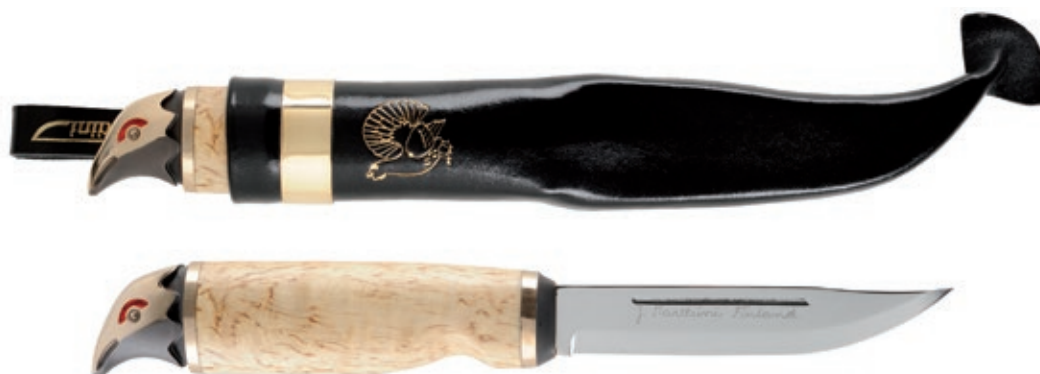
Wood Grouse MT 549019