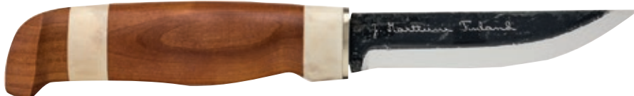
Lumberjack MT 127013