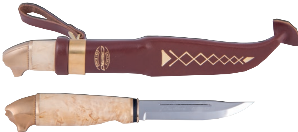
Bear Knife MT 549011