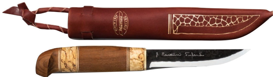
Lynx Klerinki MT 126010