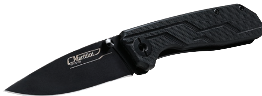
Pieghevole G10 MT 970110