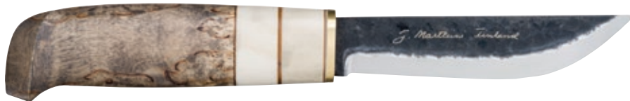
Aapa MT 131030