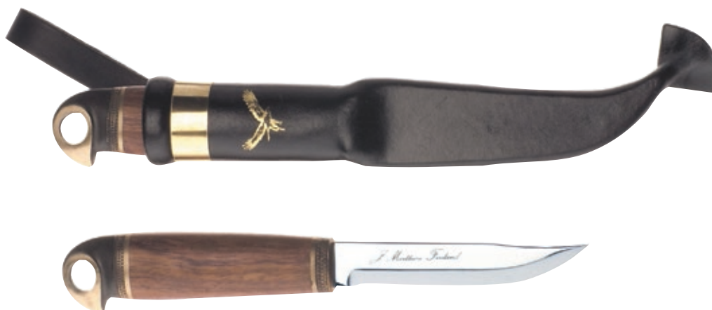
Bronze Bird MT 555010