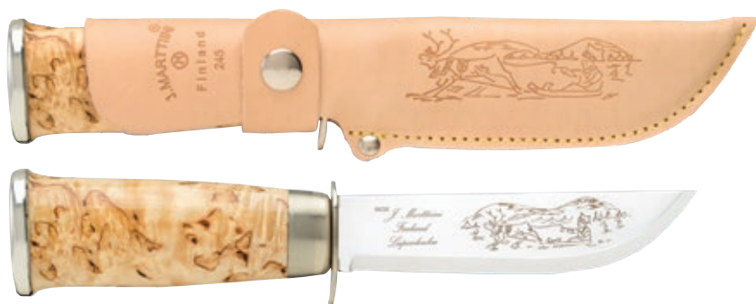
Lapp 245 MT 245010