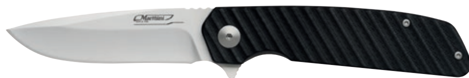
Pieghevole G10/MM85 MT 970210 • Lunghezza lama: 8,5 cm • Lunghezza totale: 20 cm