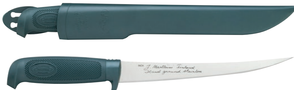
Basic 6" MT 827010